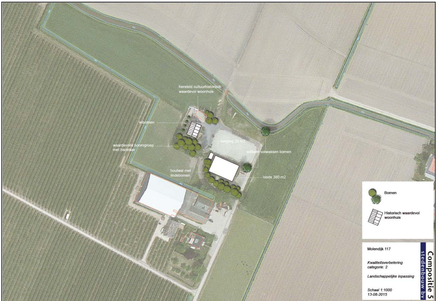
Weergave kwaliteitsverbetering locatie Molendijk 117.