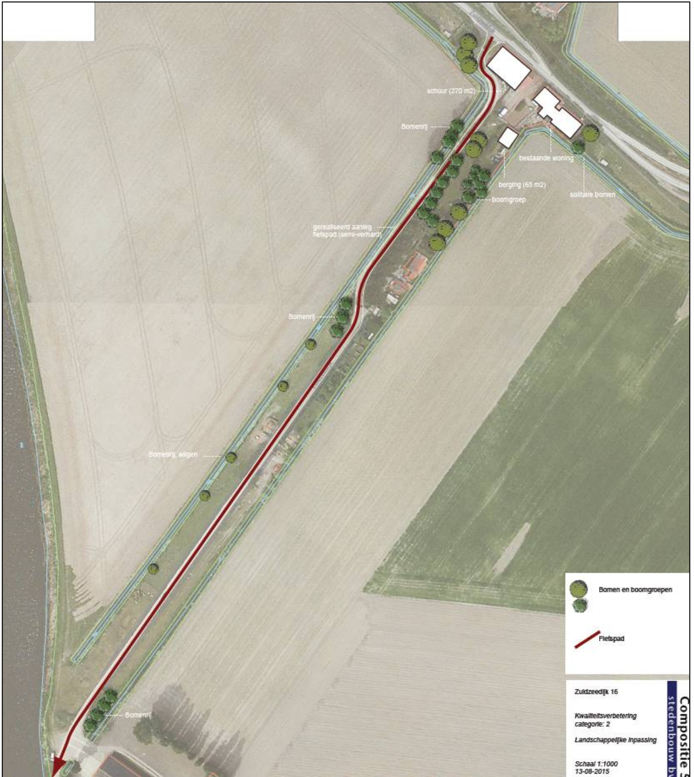
Weergave kwaliteitsverbetering locatie Zuidzeedijk 16.