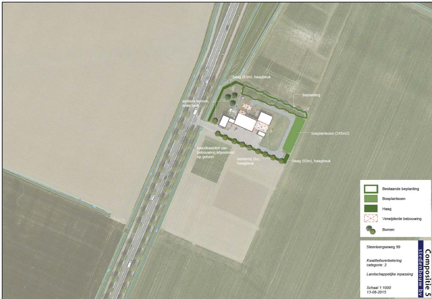
Weergave kwaliteitsverbetering locatie Steenbergseweg 99.