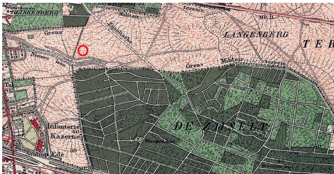
Afbeelding: Situatie plangebied rond 1906, net na de komst van het garnizoen naar Ede en het voltooiën van de eerste bouwcampagne nabij het Station Ede-Wageningen. Duidelijke demarcatie tussen voormalig heidegebied ('Grens Militair Terrein') enerzijds en de overgang naar het bosgebied van De Zijssel anderzijds.

Als gevolg van de oorlogsdreiging vanuit Duitsland aan het eind van de jaren dertig werd de dienstplichtwet gewijzigd, waardoor er op korte termijn behoefte was aan vierentwintig nieuwe kazernes in Nederland. Het garnizoen in Ede breidde haar arsenaal aan kazernes vervolgens uit met de Elias Beeckmankazerne, die in 1939 werd geopend. De nieuwe kazerne maakte onderdeel uit van een omvangrijke bouwopgave van nieuw te bouwen kazernes met als doel het huisvesten van de grote, nieuwe aanwas van dienstplichtigen. Het complex in Ede werd vernoemd naar vaandrig Elias Beekman van het Staatse leger.