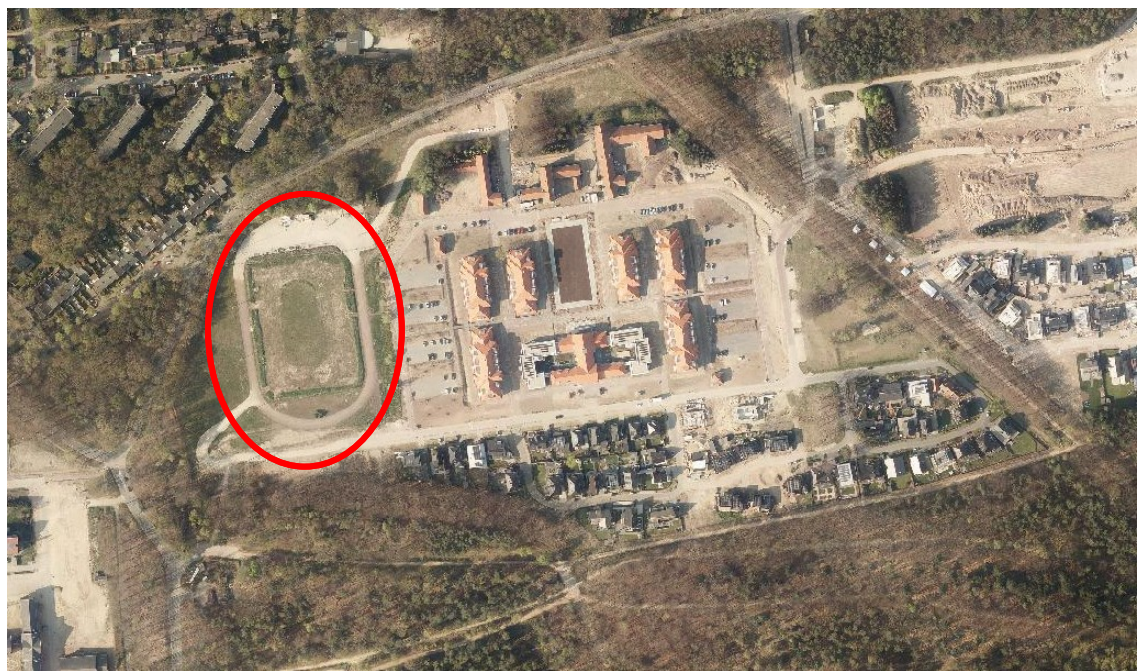
Afbeelding: Luchtfoto Elias Beekmankazerne met de atletiekbaan