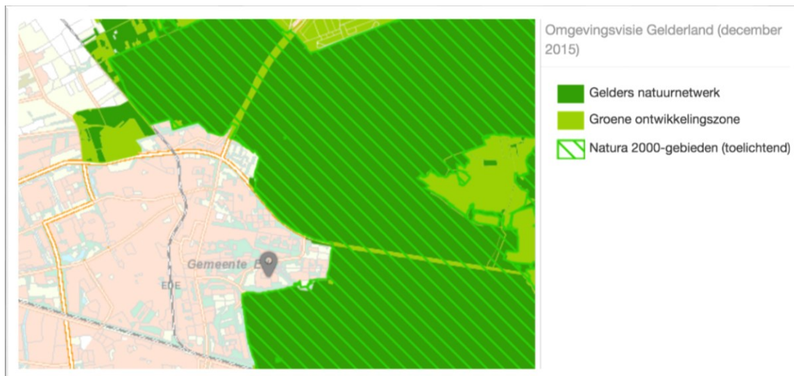
Afbeelding: Uitsnede Kaart Gelderse Natuurnetwerk (GNN)

Zie voor de voor het bestemmingsplan relevante waarden paragraaf 4.6.