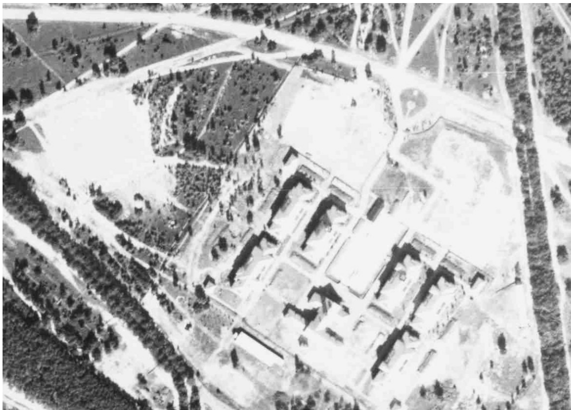
Afbeelding: Situatie plangebied (links) in 1944. Rechts de (nog niet afgebouwde) Elias Beeckmankazerne. Links hiervan (terrein huidige bestemmingsplangebied) zijn diverse solitaire en bosschages gesitueerd, naast een padenstructuur, waarvan vandaag de dag door de vele wijzigingen in het functionele gebruik van het terrein echter geen waardevolle sporen meer zijn overgebleven.

Het plangebied is sinds de aanleg van Elias Beeckmankazerne steeds gebruikt als een utilitair terrein, waar later een sportveld op werd aangelegd, en weer later een atletiekbaan. Direct aangrenzend werd een militaire sporthal gebouwd (geen monumentale waarde), die in 2017 werd gesloopt.