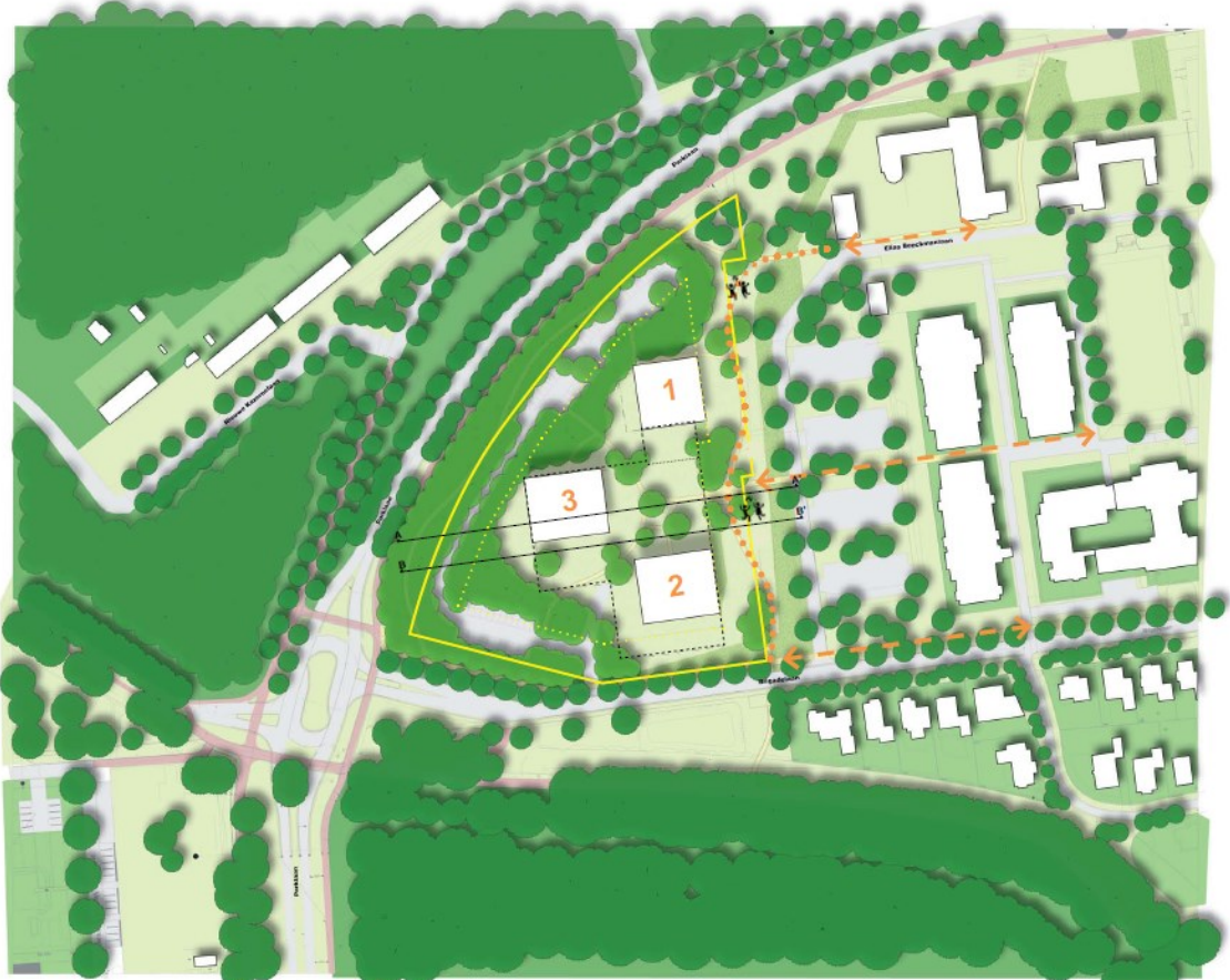
Afbeelding: proefverkaveling en randvoorwaarden

Het woningbouwprogramma wordt in drie woongebouwen gerealiseerd: