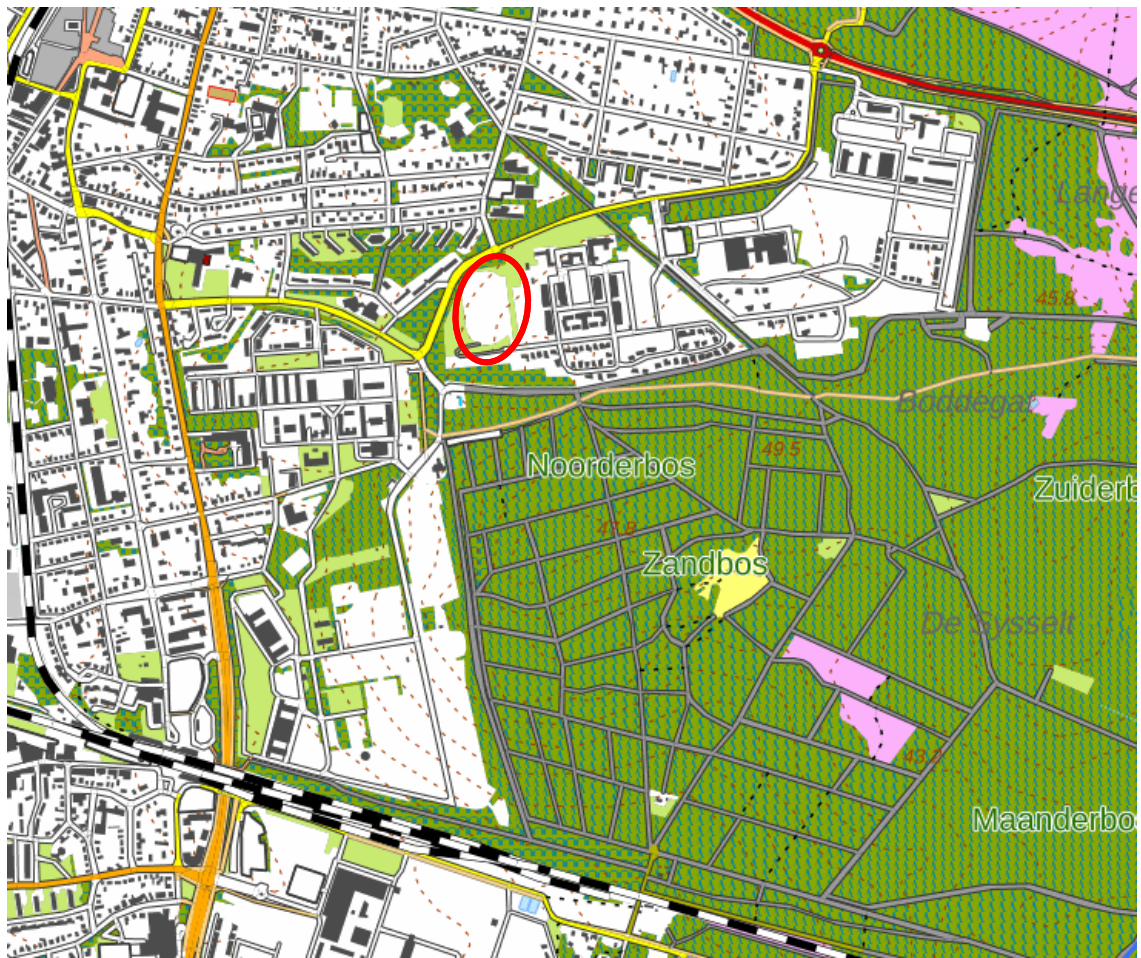
Afbeelding: Ligging plangebied