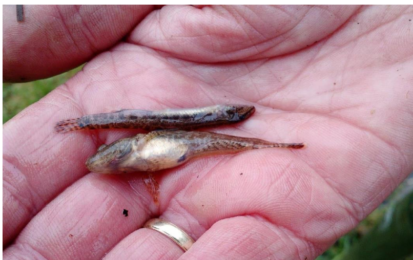
Kleine modderkruiperen Kesslers Grondel gevangen in het plangebied.