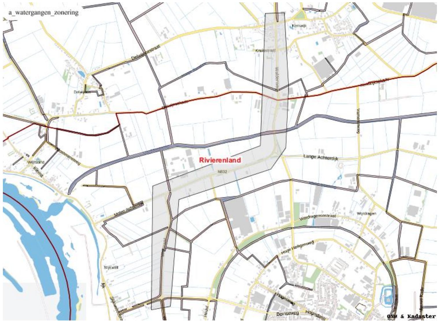
Afbeeldingen geraakte signaleringskaarten