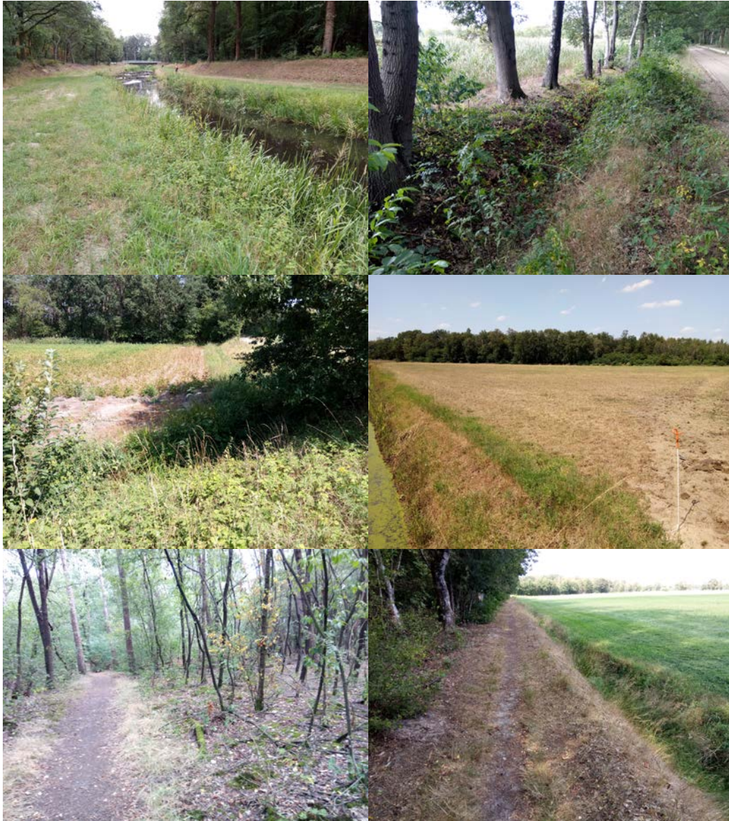
Figuur 2.2 Impressie van het deelgebied