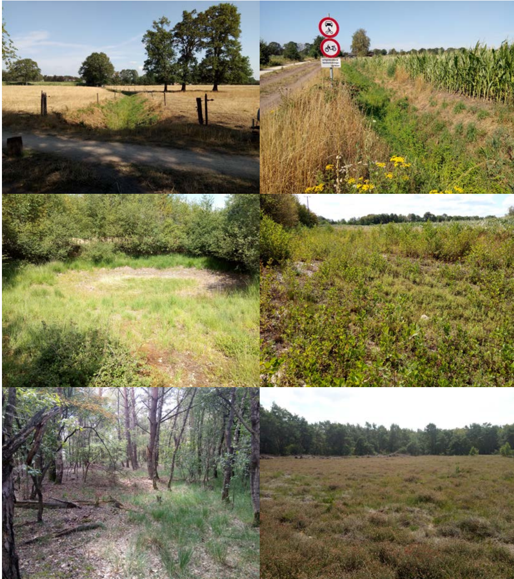
Figuur 2.2 Impressie van het deelgebied