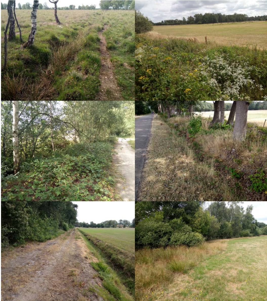
Figuur 2.2 Impressie van het plangebied