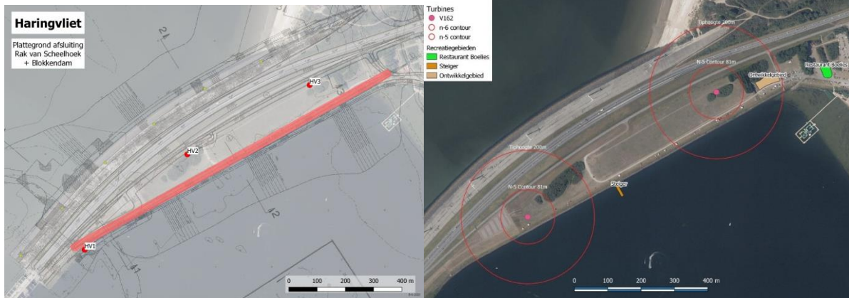
Afbeelding 2: Globale aanduiding blokkendam