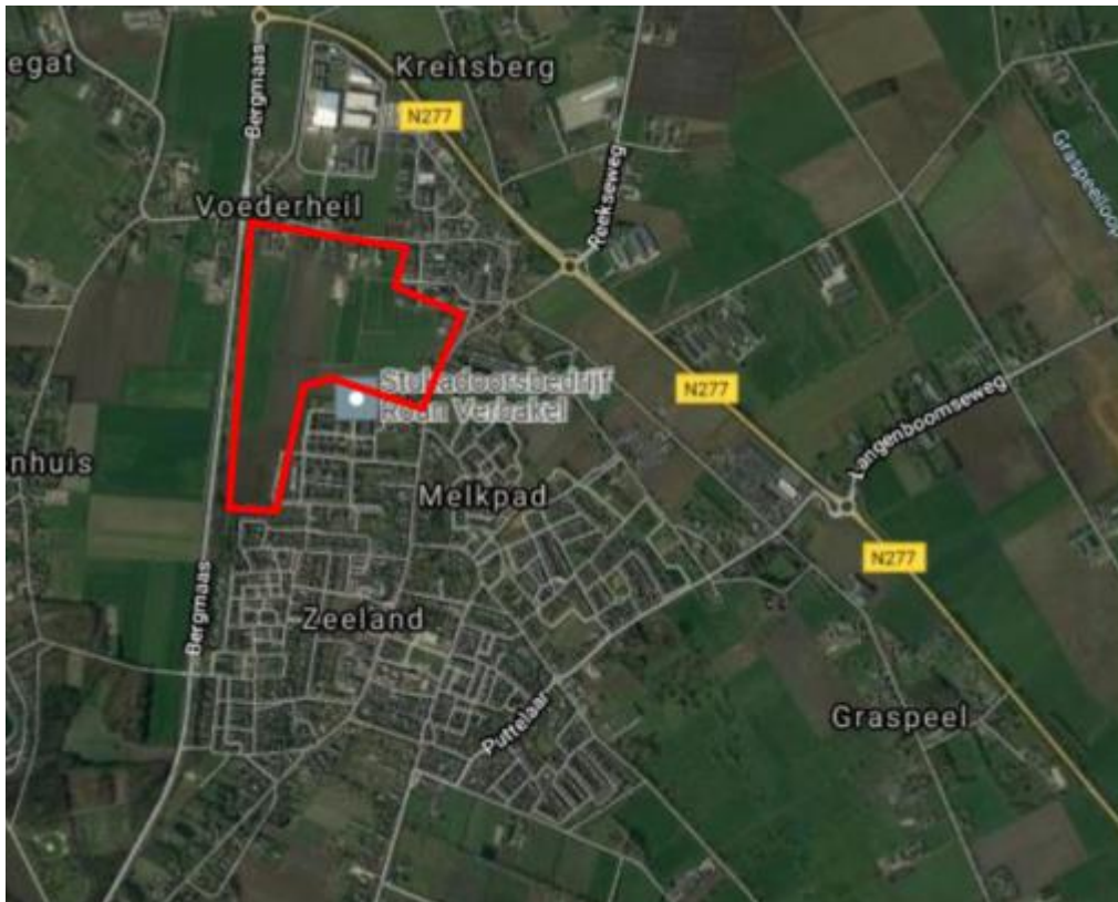
Afbeelding: Ligging Repelakker III in Zeeland.

In het huidige bestemmingplan 'Buitengebied' (hierna: 'het bestemmingsplan'), zij de gronden binnen het plangebied aangeduid met de bestemming 'Agrarisch-2'. De gronden zijn blijkens artikel 4.1.1 aanhef en onder a, van de planregels bestemd voor de ontwikkeling van een gemengde plattelandseconomie: