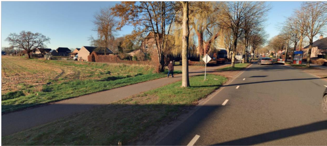
figuur 2: aansluiting Pastoor van Winkelstraat

De aansluiting van het plangebied op de Pastoor van Winkelstraat moet nog uitgewerkt worden. Het huidige landbouwperceel heeft een weinig gebruikte aansluiting in de vorm van bermverharding, zie figuur 2.