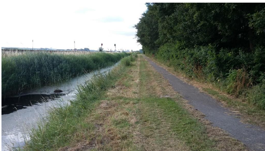
Fietspad en watergang oostzijde plangebied

De plannen bestaan uit het realiseren van woningen. Hiertoe wordt een deel van het opgaand groen gekapt en grond vergraven. Er zijn geen werkzaamheden voorzien aan omliggende watergangen.