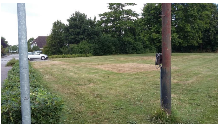
Noordwesthoek plangebied gezien vanuit het zuidoosten

Het plangebied betreft een voormalig voetbalveld in het verlengde van de weg De Vang, aan de oostzijde van Adorp. Ten westen van het plangebied ligt een wandelpad, watergang en spoorlijn. Het terrein is omzoomd door bomen en struiken. De bomenrij langs de oostzijde van het plangebied hoort echter niet tot het plangebied. Een groot deel van het terrein is in gebruik als weiland. De noordoosthoek betreft een gazon. In het plangebied staat geen bebouwing. Permanent oppervlaktewater is alleen buiten het plangebied aanwezig.