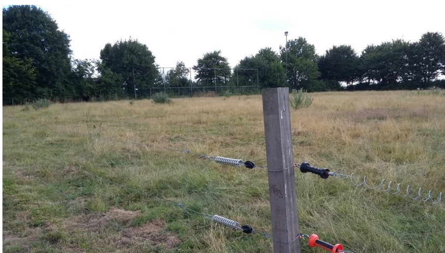
Voormalig voetbalveld gezien vanuit het noordoosten