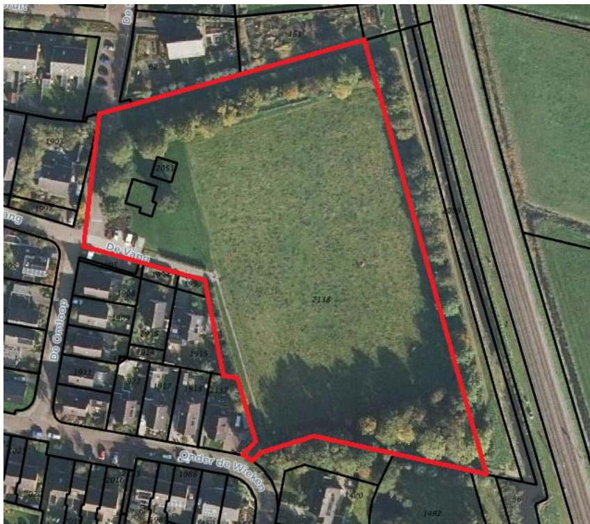
Luchtfoto met globale begrenzing projectgebied

Om de uitvoerbaarheid van het plan te toetsen, is een inventarisatie van natuurwaarden uitgevoerd. Het doel hiervan is om na te gaan of aanvullend onderzoek in het kader van de Wet natuurbescherming (Wnb) 1 of het provinciaal ruimtelijk natuurbeleid noodzakelijk is. Naast het raadplegen van bronnen is het plangebied ten behoeve van de inventarisatie op 6 juli 2018 bezocht door een ecooloog van BügelHajema Adviseurs. De weersomstandigheden waren: licht bewolkt, windstil en circa 15 °C.