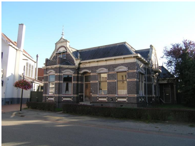
Impressie van het deelgebied Kerkstraat op 18 september 2018

In het deelgebied Hoofdstraat staan bedrijfspanden met aan de noordwestzijde een klein gazon en opgaande beplanting. De panden zijn opgetrokken uit bakstenen en hebben voor een groot deel een plat dak. Een klein deel van het dak is bekleed met dakpannen. Daarnaast is een kleine schuur aan de westzijde van het deelgebied aanwezig die is opgetrokken uit bakstenen en waarvan het dak is bekleed met dakpannen. Tussen de panden is verharding in de vorm van bestrating aanwezig. Permanent oppervlaktewater is niet aanwezig in het deelgebied.