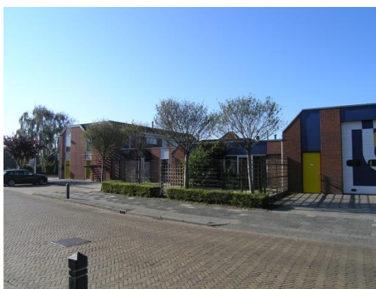
Impressie van het deelgebied Hoofdstraat op 18 september 2018.