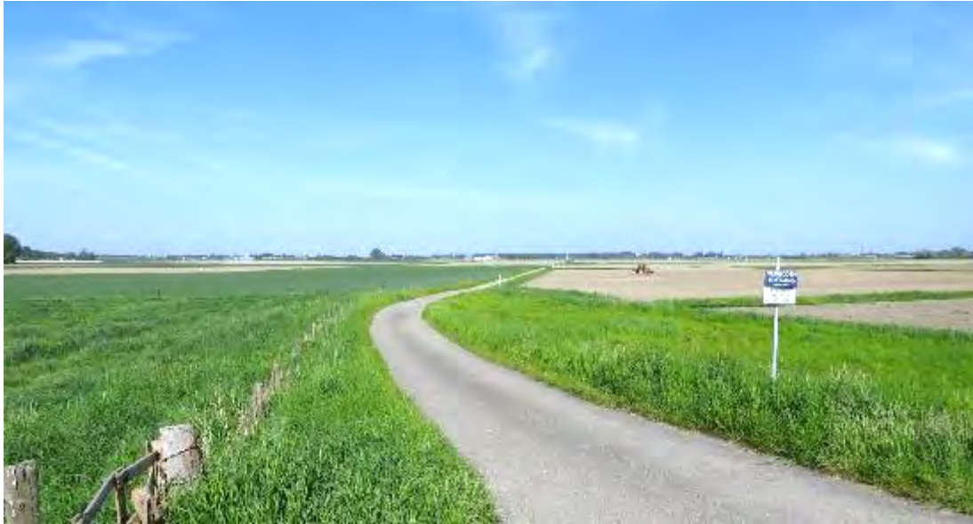
Figuur 2. Het beoogde tracé maakt gebruik van de bestaande inspectiepaden op de buisleidingstraat