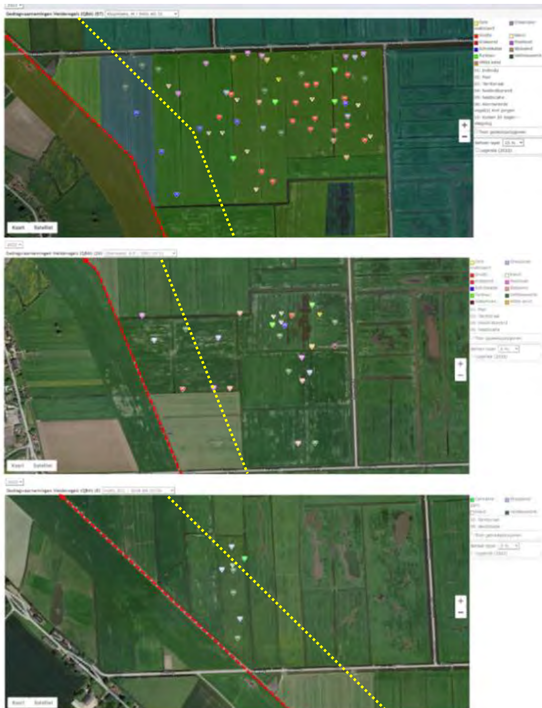
Figuur 6. Broedende weidevogels binnen de verstoringszone (gele contour)