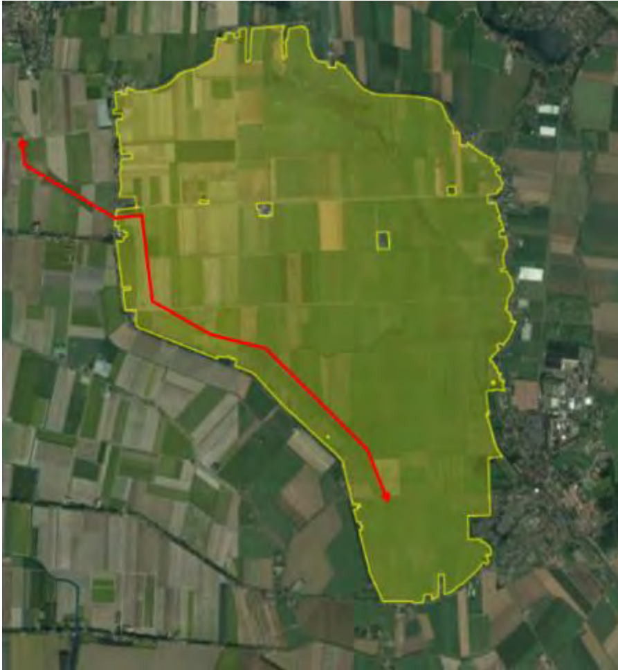
Figuur 1. Ligging tracé (rood) ten opzichte van Natura 2000 (geel)