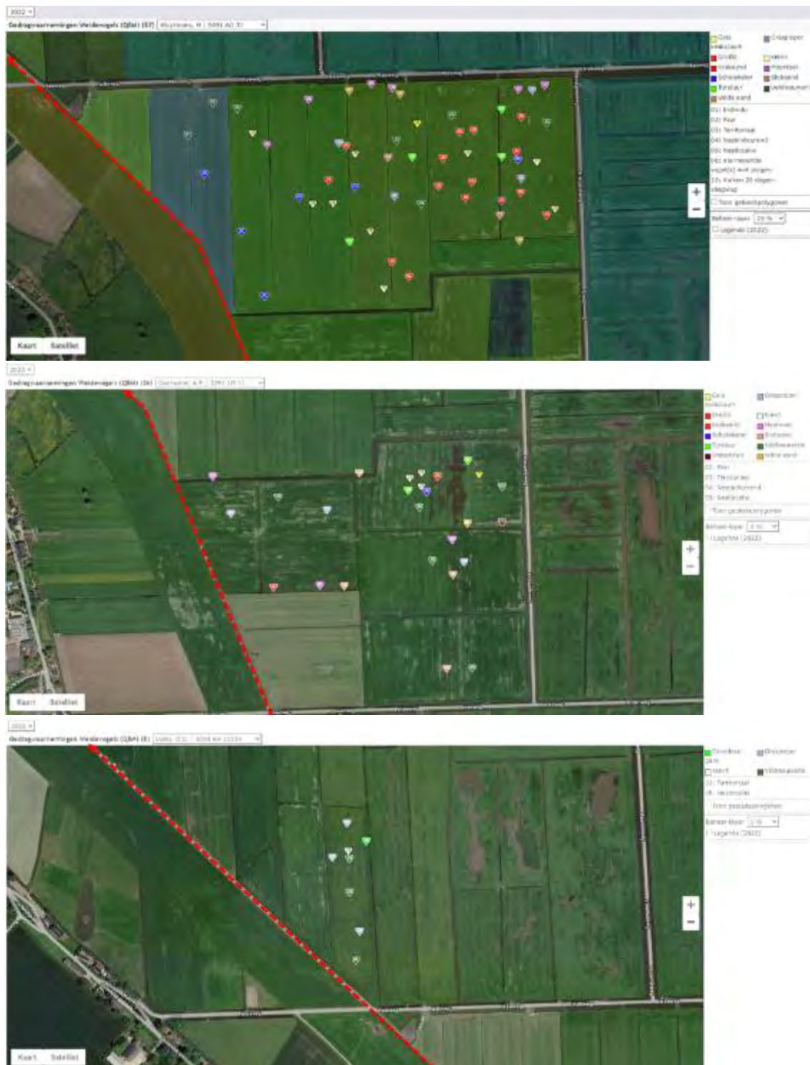
Figuur 5. Broedgevallen weidevogels 2022 nabij buisleidingenstraat

Langs het beoogde fietspadtracé broeden volgens gegevens van het Hoekschevaards landschap weinig weidevogels, zoals weergegeven in figuur 5.