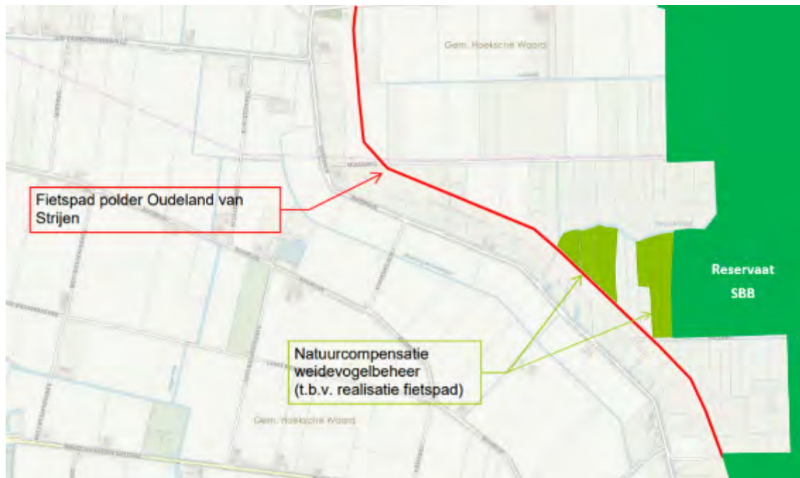
Figuur 7. Compensatiepercelen (lichtgroen)