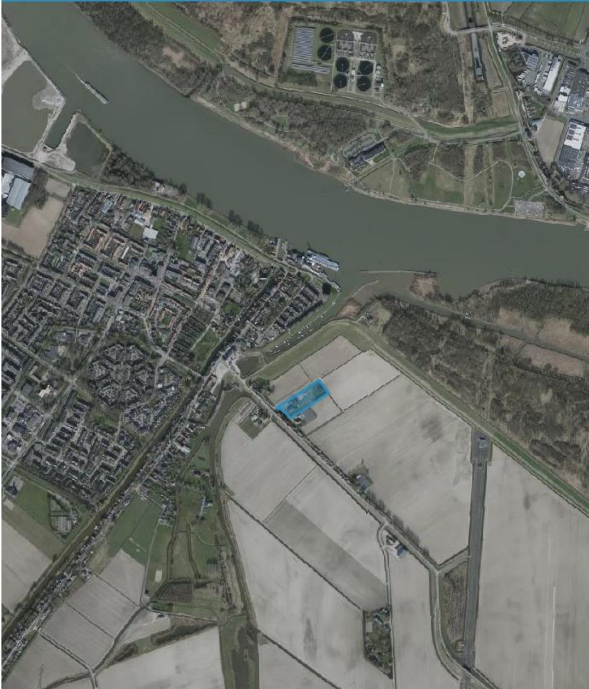
Figuur 1.1 Situering plangebied

Gowrings Holding BV heeft MBH Consult B.V. opdracht gegeven voor het uitvoeren van een onderzoek stikstofdepositie ten behoeve van het realiseren de nieuwbouw van vier woningen aan de Molendijk 14 te Puttershoek. In figuur 1.1 is een globale situering van het plan weergegeven.