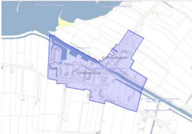
Figuur 1: begrenzing plangebied

Het plangebied “Echtenerbrug-Delfstrahuizen” is gelegen ten zuiden van het Tjeukemeer. Het bestemmingsplan geeft één regeling voor Echtenerbrug-Delfstrahuizen en heeft overwegend een conserverend karakter. De ligging van het plangebied is in figuur 1 weergegeven.