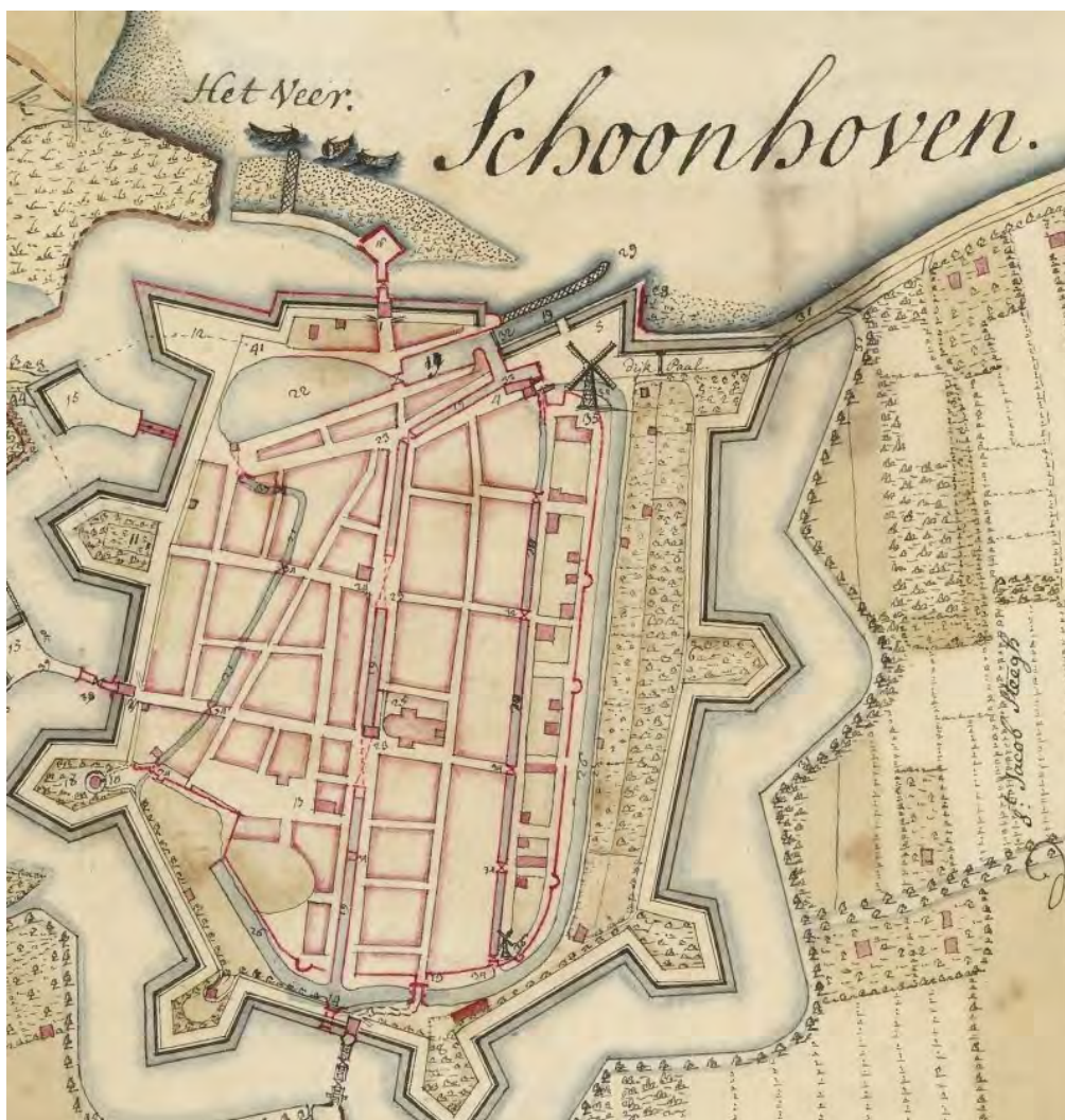
Detail van de prachtige kaart van de Lek rondom Schoonhoven en Nieuwpoort, gemaakt door J.B. Prevost (1727).

De artikelen 38 tot en met 43 1 van de Monumentenwet 1988 geven een overzicht van de belangrijkste verplichtingen die de gemeente heeft en de instrumenten die de gemeente hiervoor ten dienste staan. De gehele Monumentenwet 1988 kan worden geraadpleegd via http://wetten.overheid.nl .