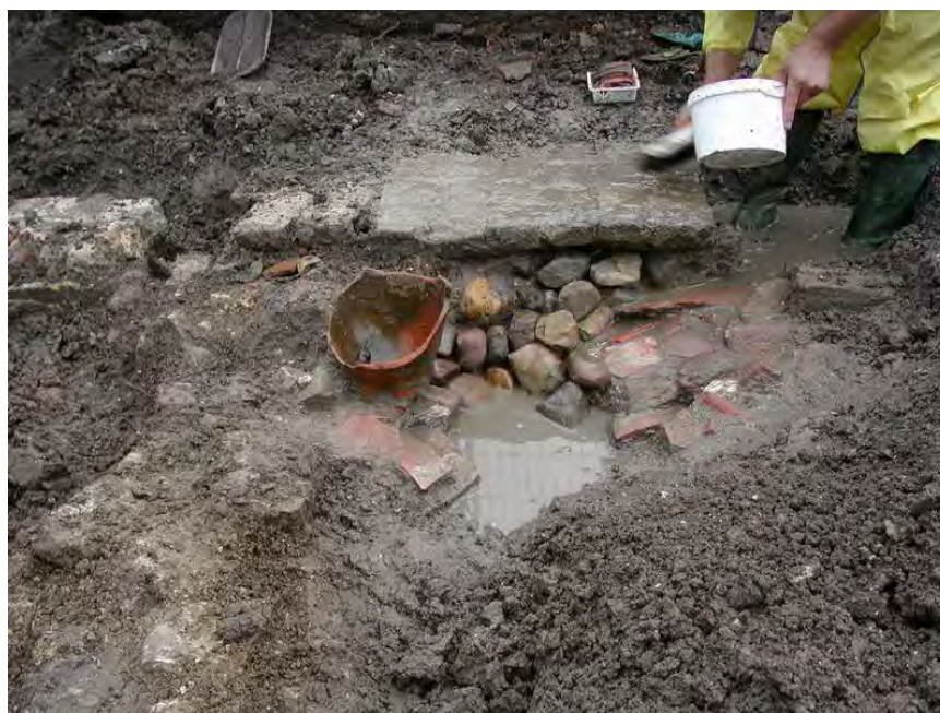
Stookplaatje van huisje naast Kloosterwal

vergunningaanvrager. In totaal zijn zes verschillende type werkzaamheden te benoemen welke in een legesverordening kunnen worden opgenomen. Dit aantal heeft te maken met de verschillende typen archeologisch (voor)onderzoek die er bestaan, variërend van bureauonderzoek tot en met een opgraving. Op hoofdlijnen gaat het om een tarief voor het in behandeling nemen van een aanvraag tot het beoordelen van een Programma van Eisen (PvE) of het in behandeling nemen van een aanvraag tot het beoordelen van een rapport waarin de archeologische waarde van het terrein dat zal worden verstoord is vastgesteld, als bedoeld artikel 37 lid 3, artikel 39 lid 2, artikel 40 lid 1 en artikel 41 lid 1 van de Monumentenwet 1988 (2). De gemeente Schoonhoven heeft ervoor gekozen de te verrichten activiteiten op het gebied van de archeologie in rekening te brengen bij de vergunningaanvrager.