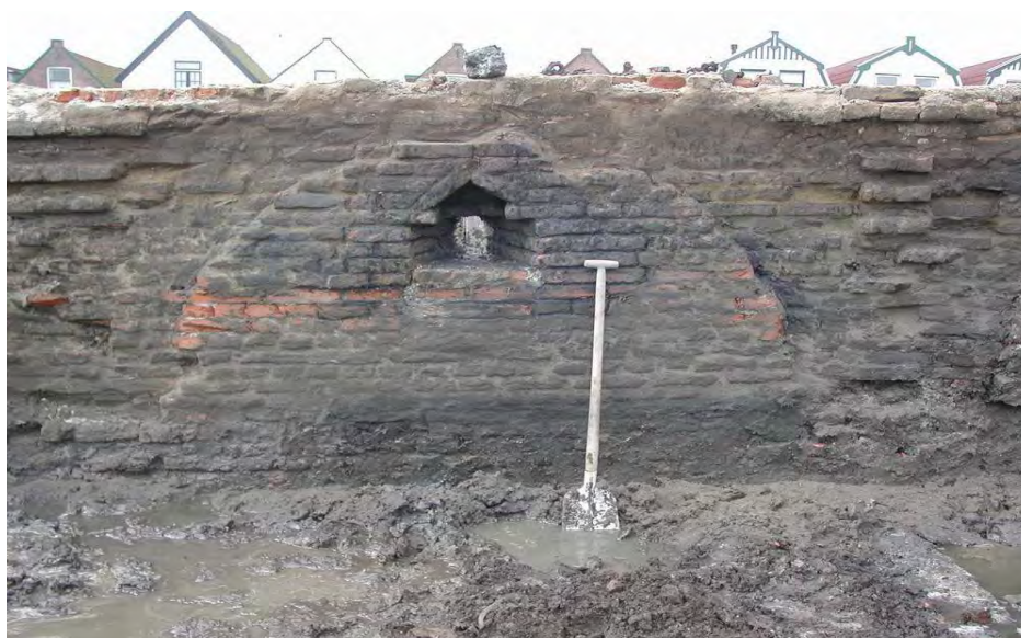
Schietgat in stadsmuur

Voor vondsten tijdens regulier onderzoek geldt dat deze eigendom zijn van de deponhouder. Dit kan de gemeente zijn, maar vaker is dat de provincie. Vanaf het moment dat vondsten zijn gedaan, is de deponhouder eigenaar.