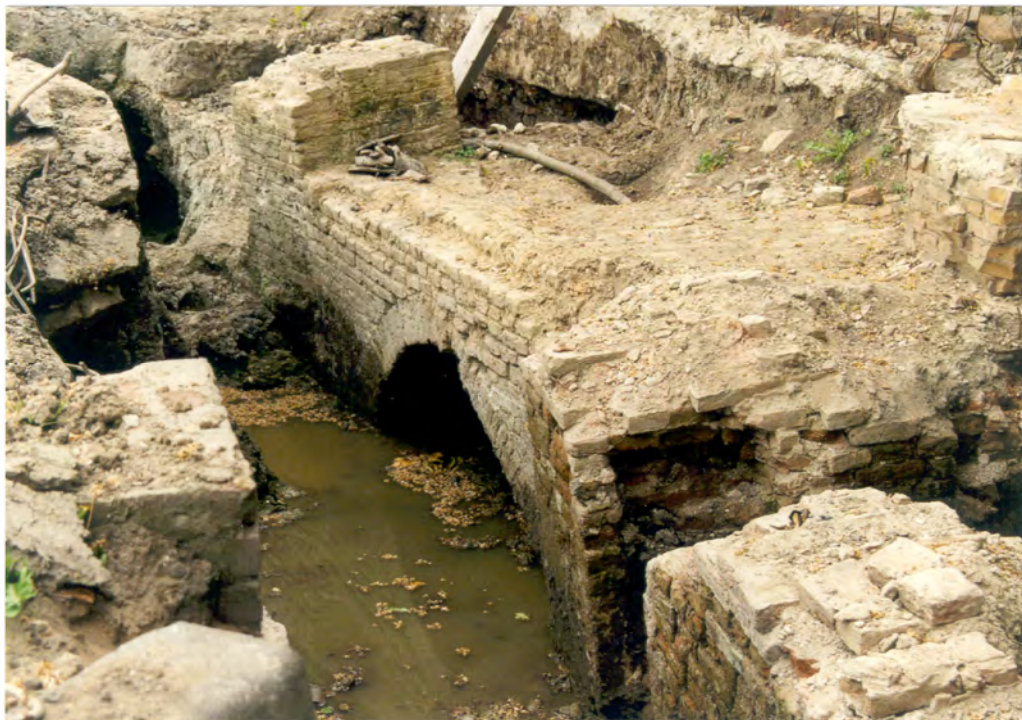
Blootlegging van de Weergangbogen bij de Cromme Grietetoren

verwachtingenkaart, is dan ook onmisbaar. De gemeente Schoonhoven heeft er daarom voor gekozen een dergelijke kaart te laten opstellen. Omdat een dergelijke kaart niet in het ruimtelijk ordeningsproces valt te gebruiken, heeft de gemeente Schoonhoven er voor gekozen ook een archeologische beleidskaart te laten opstellen. Op deze kaart is gemakkelijk te zien waar de gemeente Schoonhoven een archeologische onderzoeksplicht oplegt en waar niet.