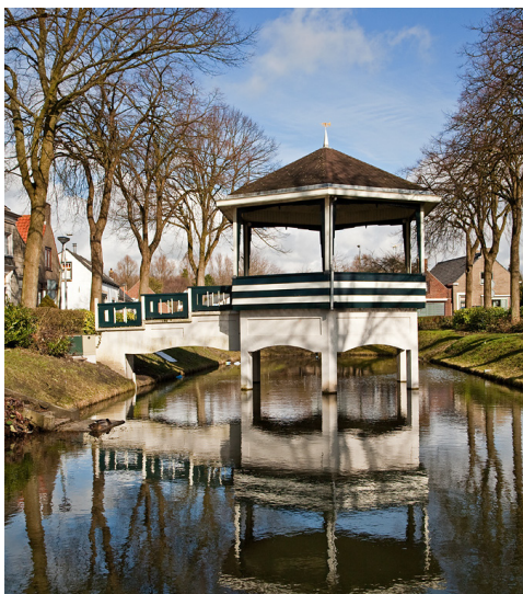
De Ring met muziektent