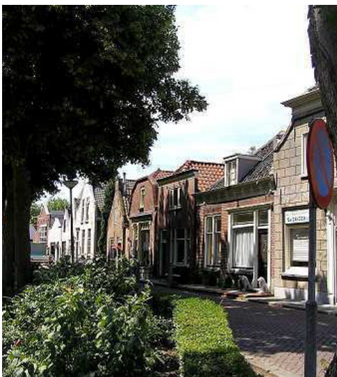
Abbenbroek de Ring