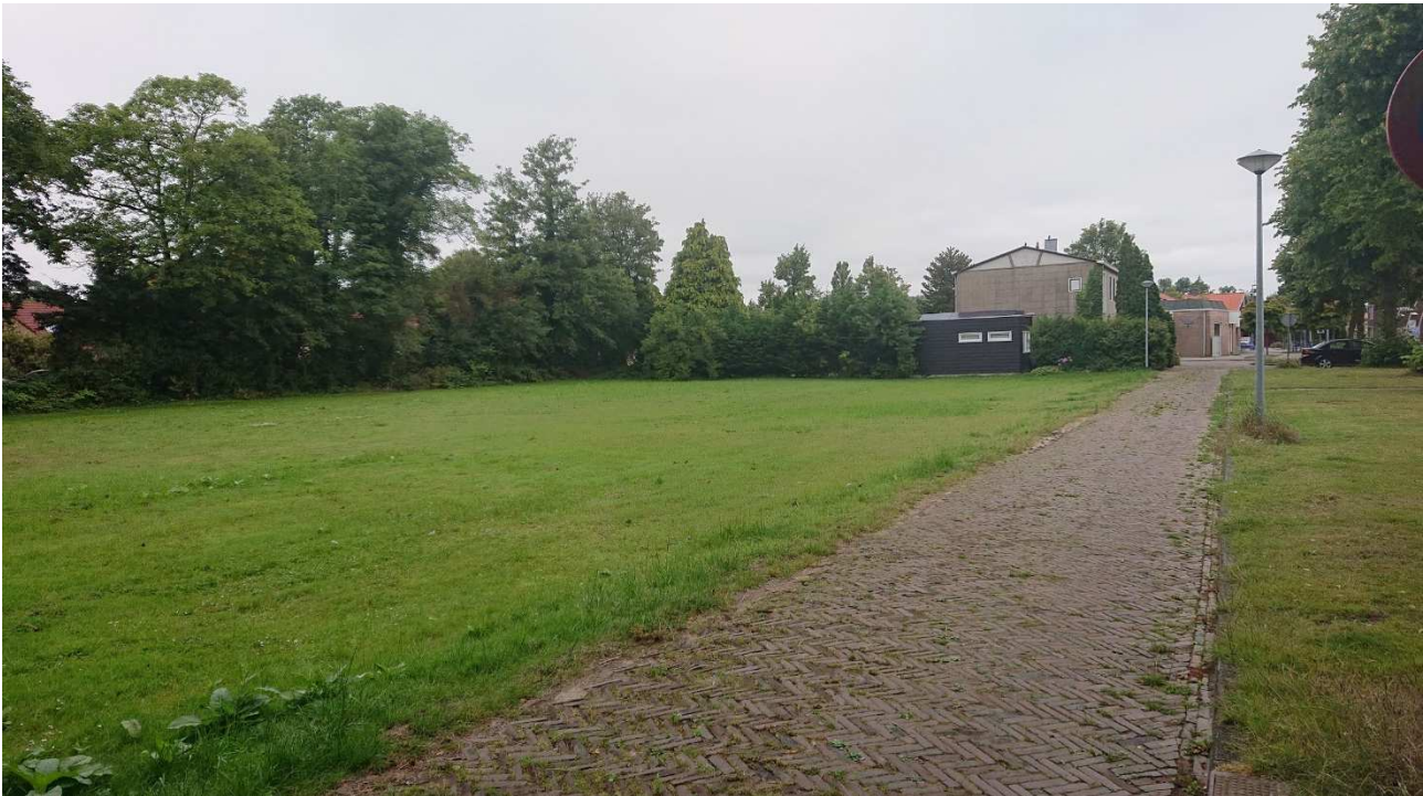
Figuur 1. Huidige situatie Sternstraat te Wieringerwerf

aangetroffen. De aanwezige bebouwing binnen Lelypark en omgeving, bevat wel mogelijkheden als vaste rust- en verblijfplaats van vleermuizen. Met name basisschool Het Bakken bevat te slopen gebouwdelen, welke toegankelijk zijn voor vleermuizen zoals open stootvoegen (spouwmuren) en overstekende en gebroken hoekpannen. Andere zwaar beschermde soorten dan hierboven genoemd worden op basis van de huidige verspreidingsgegevens en aanwezige terreintypen niet verwacht.