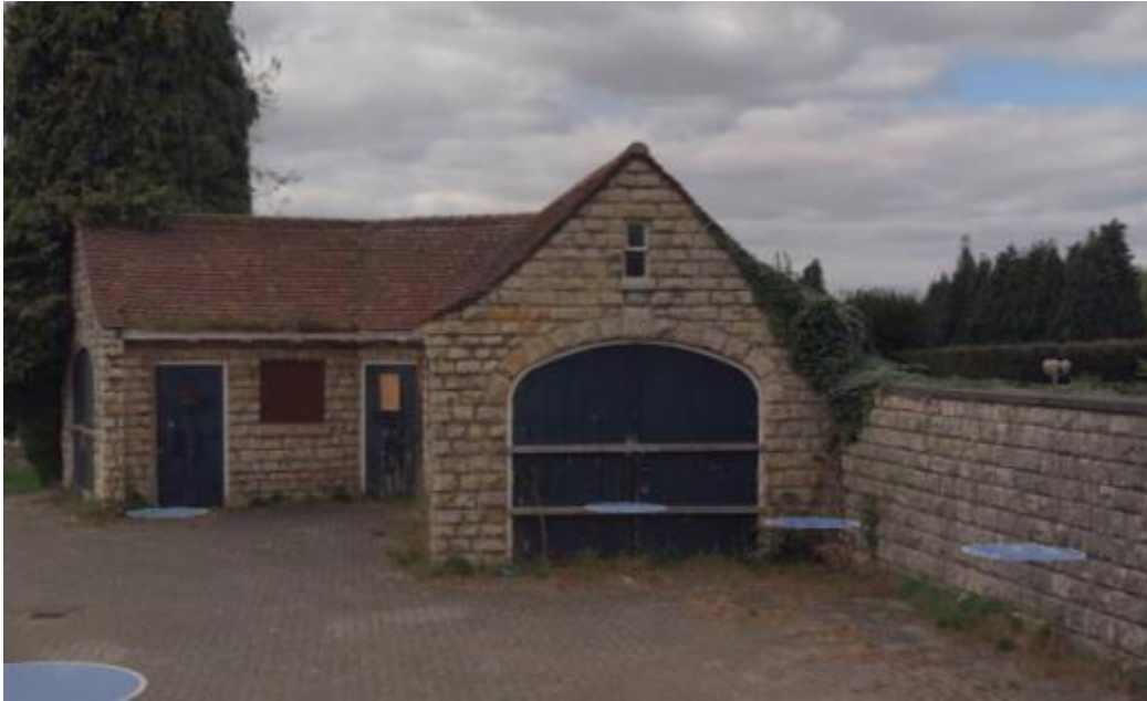
Garagegebouwtje oostzijde met aangrenzende parkmuur