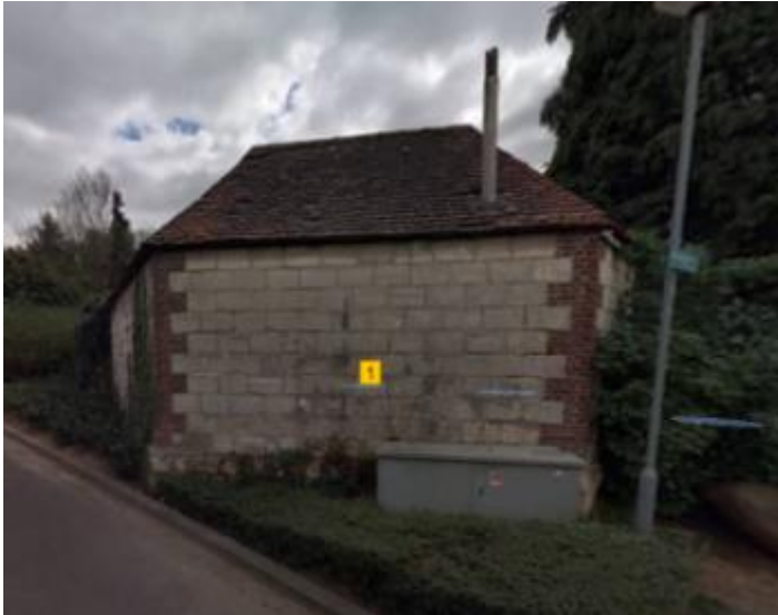
Garagegebouwtje westzijde (Parkweg)