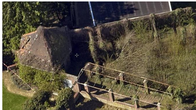
Theehuis en pergola's. De vijver is niet zichtbaar door de verwilde begroeiing