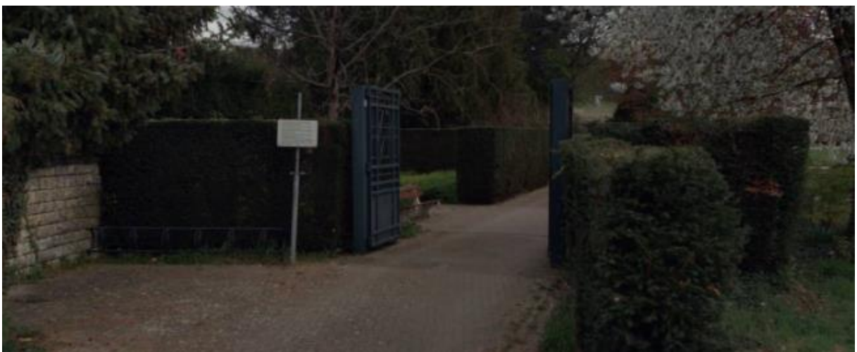
De parkmuur gaat over in een heg met ijzeren toegangspoort, vergelijkbaar met de toegangspoort aan de Voerenweg