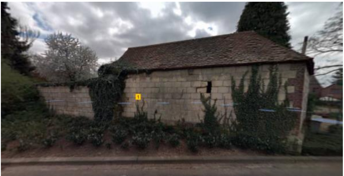
Garagegebouwtje met aangrenzende parkmuur straatzijde (Parkweg)