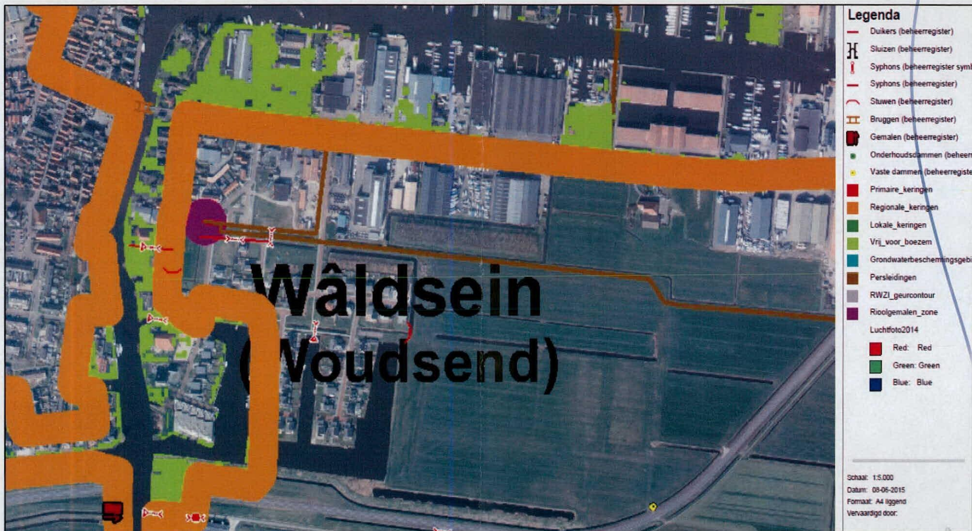
Bijlage 1, overzicht locatie objecten en belangen Wetterskip Fryslân