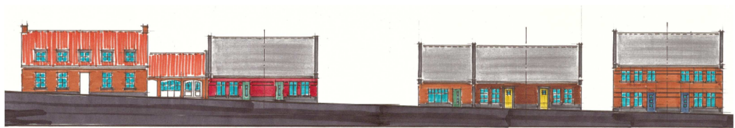
Afbeelding 5: indicatief aanzicht zijde Maasstraat