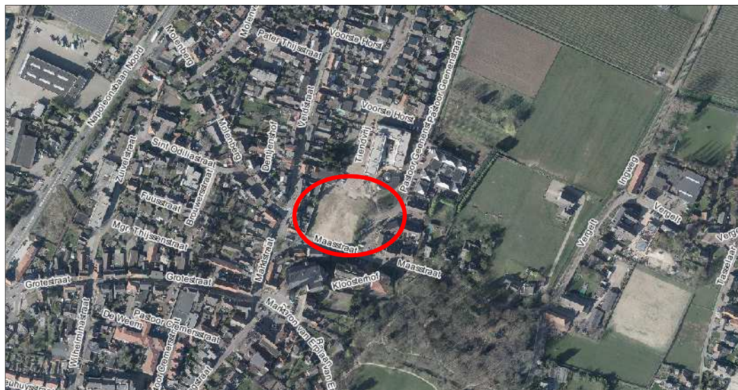
Afbeelding 3: luchtfoto plangebied en omgeving

Het bouwplan maakt deel uit van het grotere project 'Rond de Engelbewaarder'. Naast de bouw van nieuwe woningen wordt in dat kader de historische kleuterschool de Engelbewaarder in oude glorie hersteld. Hier omheen realiseert Wonen Limburg in nauwe samenwerking met de gemeente Peel en Maas een grote variëteit aan woningen. Het plan Rond de Engelbewaarder wordt in drie fasen gerealiseerd. Allereerst is de Horizon gebouwd. Het Heem is nagenoeg gerealiseerd. Tot slot wordt het Hof gerealiseerd. Dit bestemmingsplan voorziet in een andere planinvulling van het gebied het Hof dan eerder was voorzien.