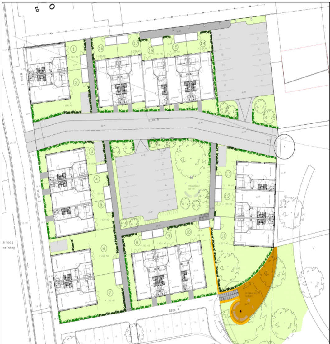
Afbeelding 4: situatieschets te realiseren woningen 10-3-2015