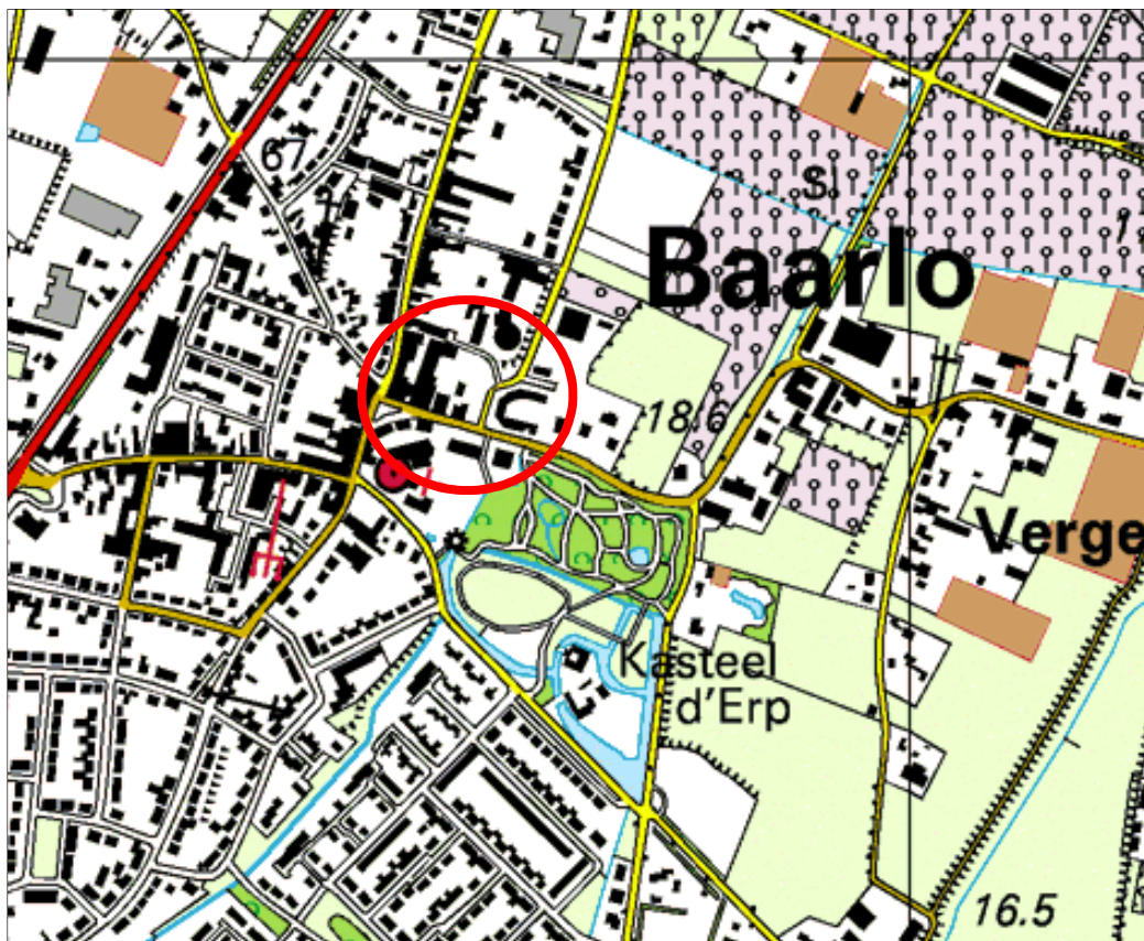
Afbeelding 1: topografische kaart plangebied en omgeving

Wonen Limburg heeft bij de gemeente Peel en Maas aangegeven dat zijn een andere invulling willen geven aan een deel van het plan 'Rond De Engelbewaarder' in Baarlo, namelijk het gebied gelegen op de hoek Pastoor Geenenstraat en Maasstraat (het Hof geheten). De ontwikkeling voorziet in het realiseren van 18 grondgebonden levensloopbestendige woningen, daar waar volgens het nu nog vigerende bestemmingsplan 34 appartementen en 6 grondgebonden woningen zijn toegestaan. Deze ontwikkeling is strijdig met het geldende bestemmingsplan. De gemeente Peel en Maas heeft aangegeven voor deze ontwikkeling een nieuw bestemmingsplan vast te willen stellen. Door middel van onderhavig bestemmingsplan worden de nieuwe bouw mogelijkheden voor de gronden juridisch-planologisch geregeld.