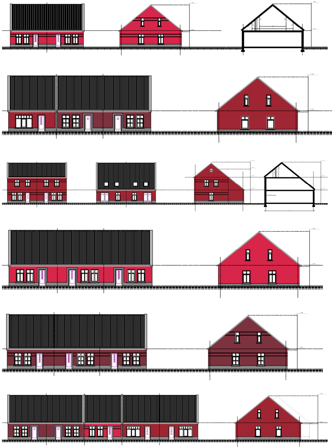
Afbeelding 6: principe gevelbeelden en doorsneden te realiseren woningen