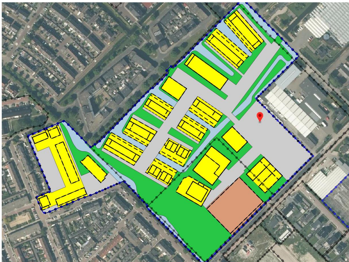
Figuur 1: plangebied vastgesteld bestemmingsplan.

De gemeente Zuidplas wil woningbouw ontwikkelen op de locatie van het sportpark Van 't Verlaat in Zevenhuizen. Naast het plangebied (aan de oostzijde, zie figuur 2) ligt een bedrijvenlocatie waar een aantal bedrijven zich kunnen vestigen binnen een beperkt oppervlak met een beperkte bedrijfsbestemming.