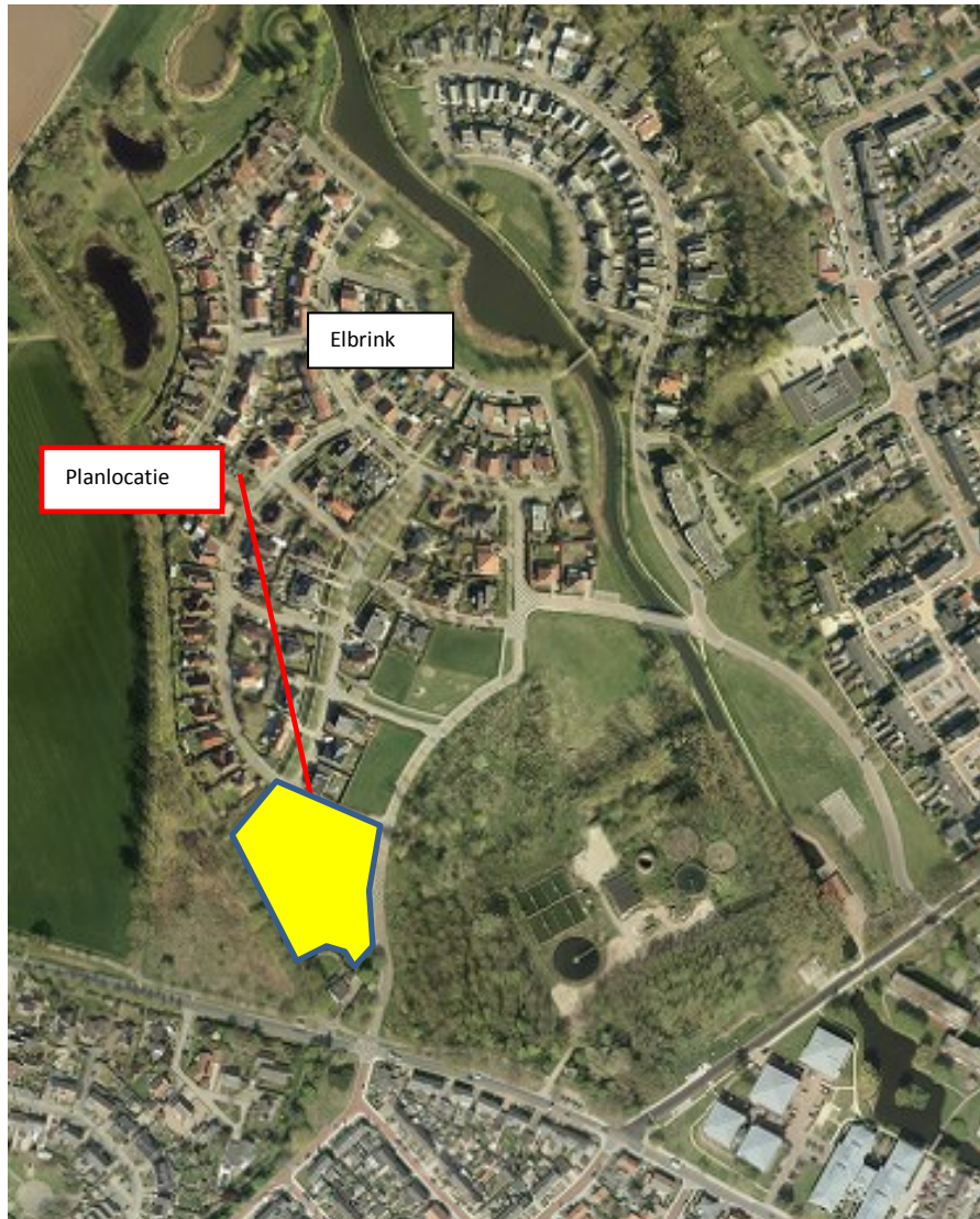
Figuur 1: ligging plangebied

Sinds 1 januari 2017 is de Wet natuurbescherming van kracht. Deze Nederlandse wet regelt de bescherming van natuurgebieden, soorten en bos. De wet vervangt drie wetten: de Natuurbeschermingswet 1998, de Boswet en de Flora- en Faunawet. Middels deze wet wordt een groot aantal plant- en diersoorten beschermd. Als er plannen zijn om bepaalde handelingen uit te voeren of wijzigingen aan te brengen in het bestemmingsplan, zal er onderzocht moeten worden of deze plannen, of onderdelen hiervan, nadelige effecten kunnen hebben op aanwezige, of mogelijk aanwezige, beschermde flora en fauna. Middels een natuurtoets kan worden bepaald of dier- en plantsoorten negatieve gevolgen kunnen ondervinden van de werkzaamheden dan wel dat er gezocht moet worden naar mitigerende en/of compenserende maatregelen.