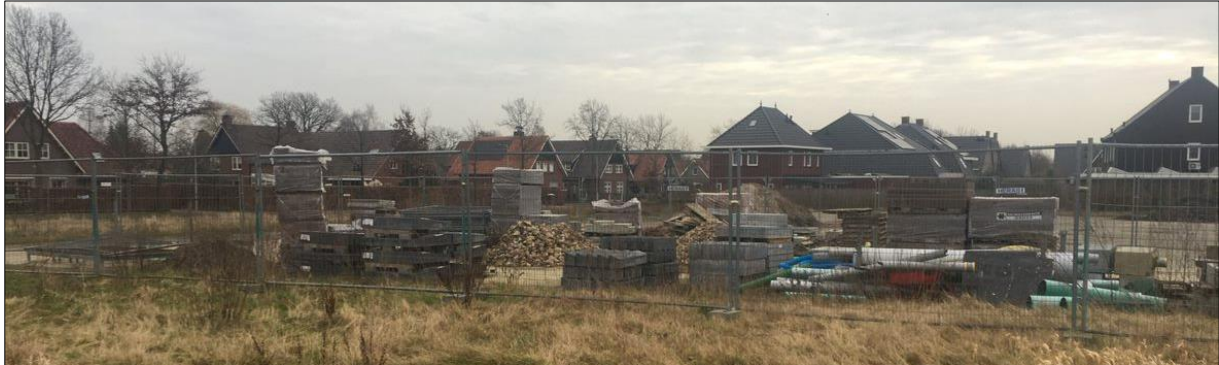
Mogelijk nestelen er vogels in de bouwmaterialen/opgeslagen spullen in het plangebied

Het plangebied wordt beschouwd als functioneel leefgebied van verschillende vogelsoorten. Vogels benutten het plangebied hoofdzakelijk als foerageergebied, maar mogelijk nestelen er vogels in de opgeslagen bouwmaterialen in het plangebied. Vogelsoorten die mogelijk in de opgeslagen spullen nestelen zijn wilde eend, merel en witte kwikstaart.