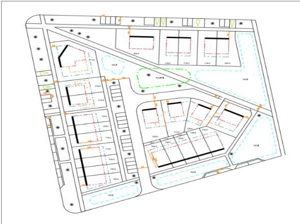
Plattegrond van het plangebied na planrealisatie

Het voornemen bestaat om 22 woningen te bouwen in het plangebied. Deze woningen worden ontsloten via aan te leggen wegen naar de straat Brookhuis aan de zuidzijde. Enkele woningen bevinden zich aan de noordzijde van het plangebied grenzend aan de Alleeweg. Aan de zuid grenskant van het plangebied worden drie wadi's aangelegd. Aan de noordwest kant van het midden en aan de oostzijde van het plangebied worden wadi's aangelegd. In het midden wordt een speelveld aangelegd. Aangenomen wordt dat de enkele loofbomen aan de grensgebieden niet verwijderd worden. Op onderstaande afbeelding wordt een plattegrond van het wenselijke eindbeeld weergegeven.