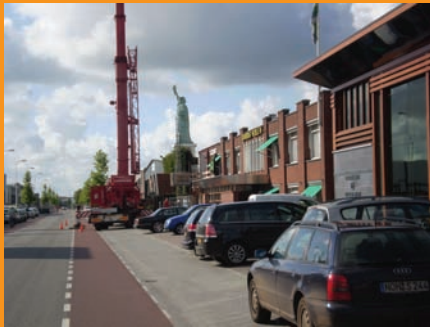
Verschuiving, intensivering bouw- cluster