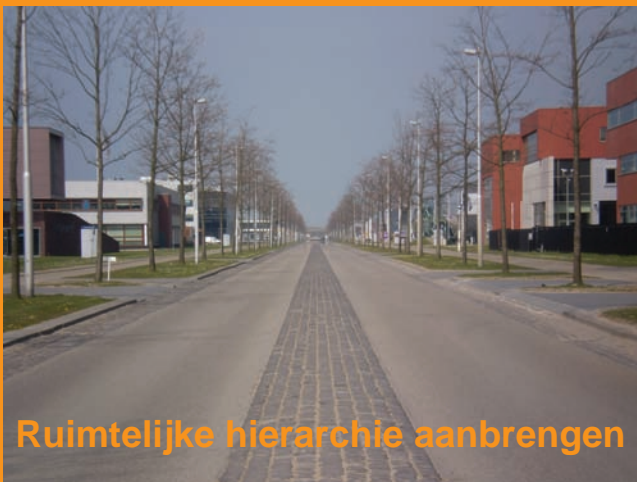
Ruimtelijke hiërarchie aanbrengen