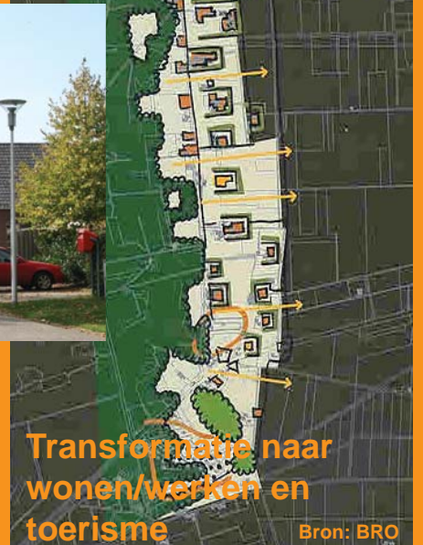
Transformatie naar wonen/werken en toerisme