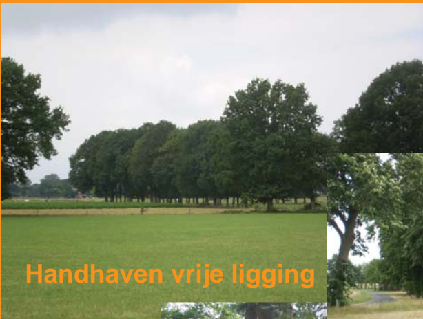
Handhaven vrije ligging

Revitalisering lanen, houtwallen, poelen.