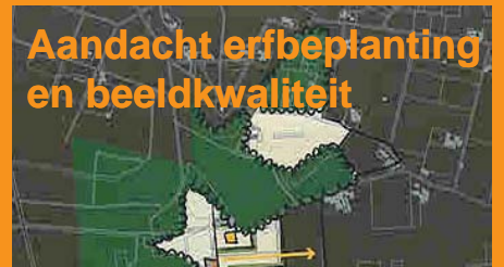
Aandacht erfbeplanting en beeldkwaliteit