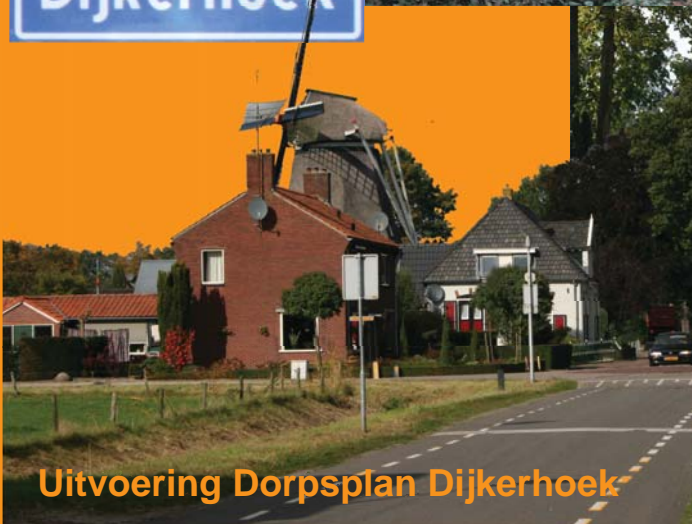
Uitvoering Dorpsplan Dijkerhoek