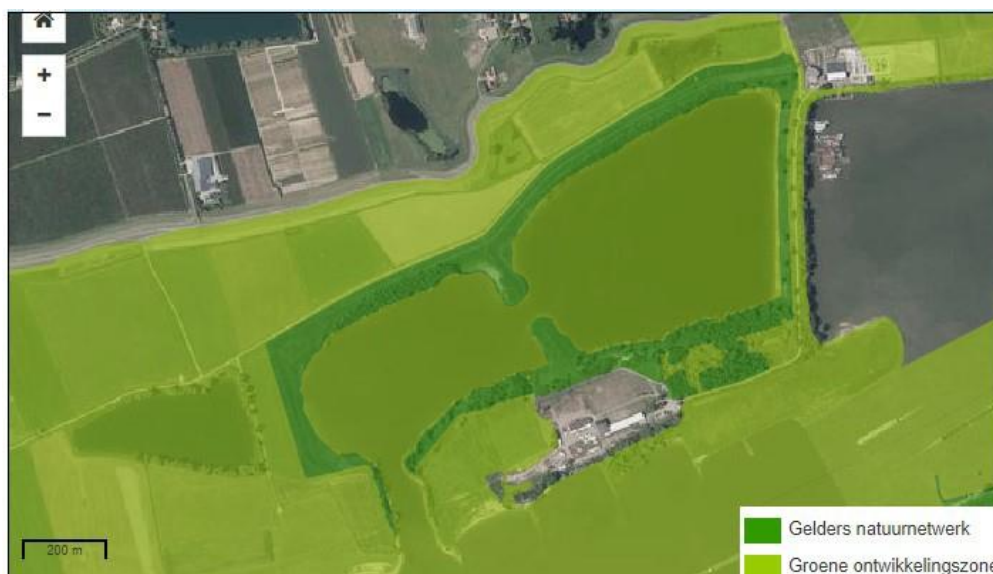
Geconsolideerde Omgevingsverordening Gelderland (december 2018)

Gelders Natuurbeleid. In het provinciaal ruimtelijk beleid wordt onderscheid gemaakt in het Gelders Natuurnetwerk (GNN) en de Groene Ontwikkelingszone (GO). Van deze gebieden zijn wezenlijke kenmerken of waarden vastgesteld, de kernkwaliteiten. Het GNN bestaat voor het overgrote deel uit bestaande natuur. In het GNN zijn geen nieuwe functies mogelijk, anders dan natuur. In de GO zijn nieuwe functies toegestaan, als aangetoond is dat de kernkwaliteiten niet significant worden aangetast en de ontwikkeling gepaard gaat met een significante versterking van de kernkwaliteiten. In de toelichting van het bestemmingplan is een andere begrenzing van