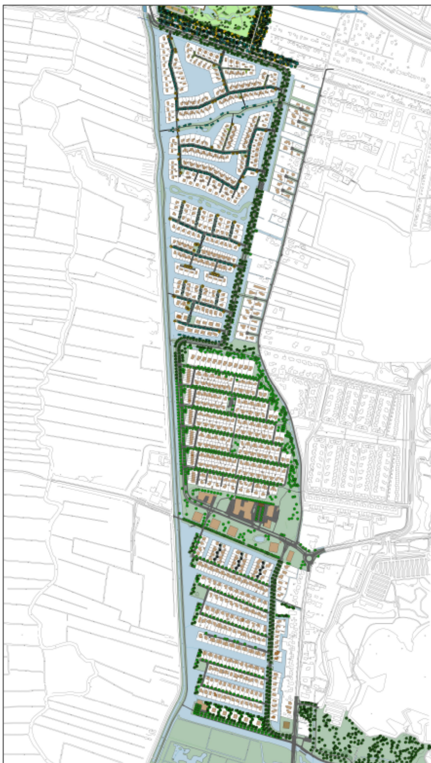
Afbeelding: Overzicht van de wijk Ter Borch met het Entreegebied