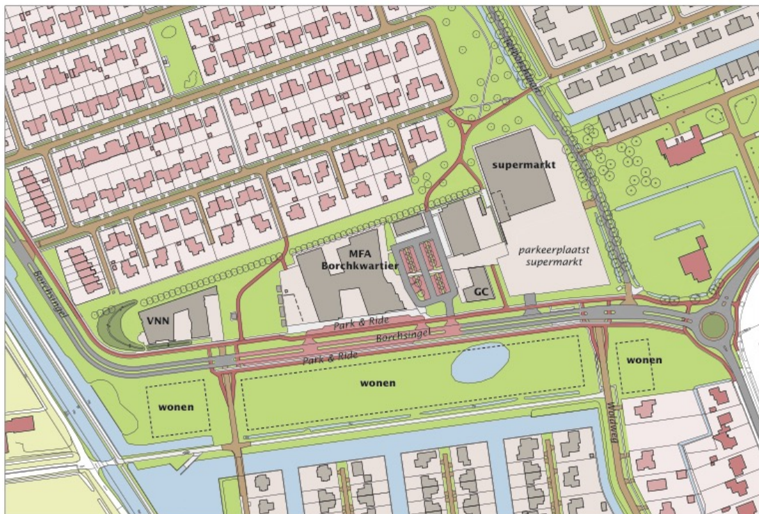
Afbeelding: Overzicht bebouwing Entreegebied in 2018 met locatie toekomstige supermarkt