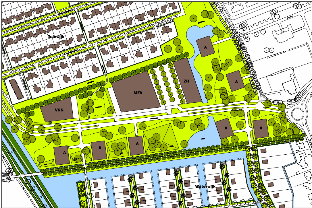
Afbeelding: Voorbeeldverkaveling Entreegebied uit 2008