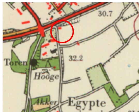
Situatie rond 1965