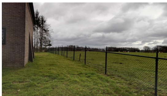
Zuidelijke perceelgrens met doorzicht naar het open landschap.