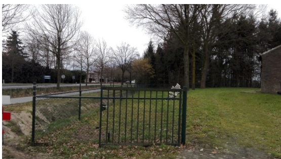
Aanzicht vanaf de Muggenhool, met links de Rondweg en achter het naaldbosje.

Vanaf de Rondweg gezien is het monument goed zichtbaar, gelegen op een verhoging in het landschap, met nauwelijks erfbeplanting op het perceel. Het plangebied is daarmee een open doorzicht naar de bolle akker, tussen twee meer besloten percelen in.