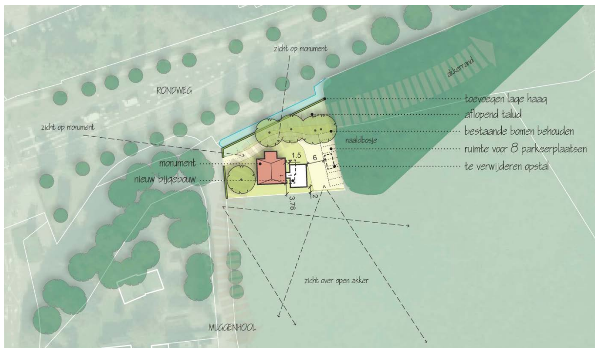
Voorstel landschappelijke verantwoording (zie bijlage voor schets op schaal)

Voor de inrichting van de hagen wordt gebruik gemaakt van inheemse beplanting, zoals veldesdoorn ( Acer campestre ) of gewone beuk ( Fagus sylvatica ). De hagen zijn aangeplant in dubbele rijen, driehoeksverband.