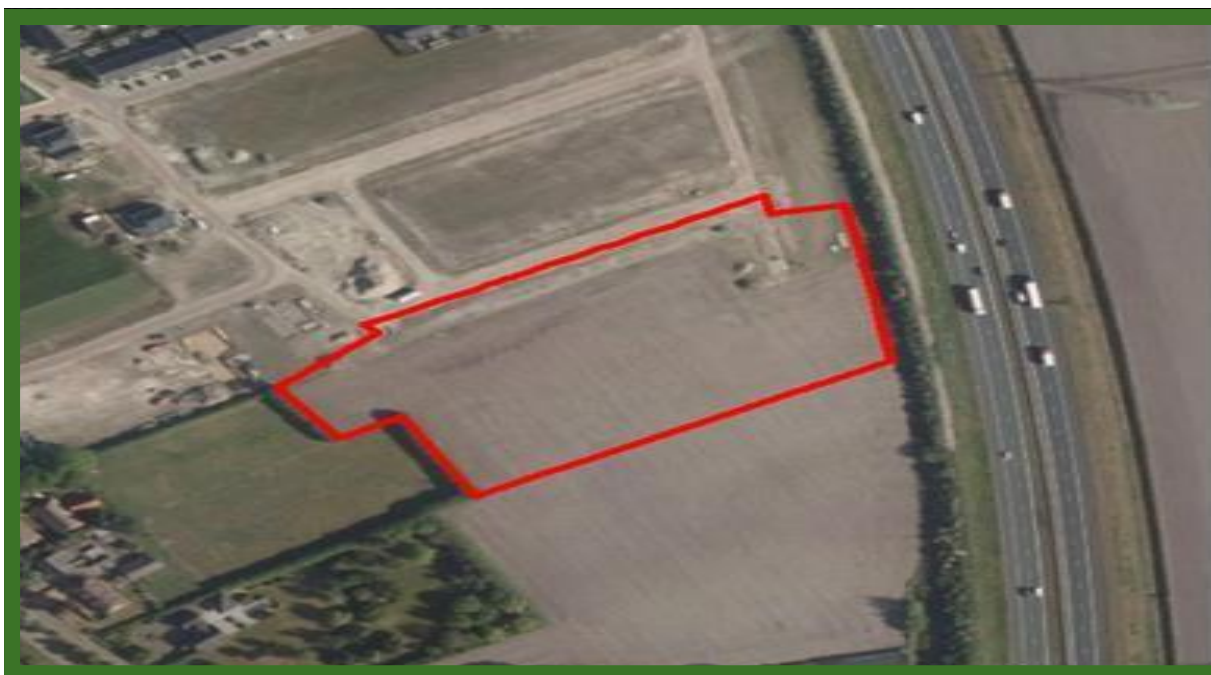
Globaal omlijnde planlocatie in rood.