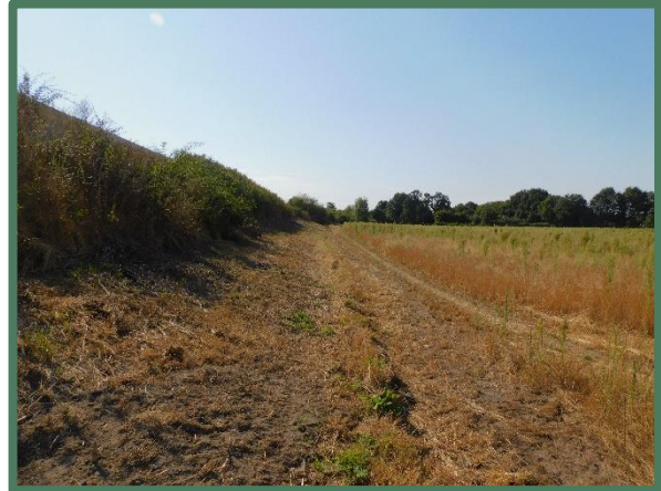
Naast geluidswal vanaf noord