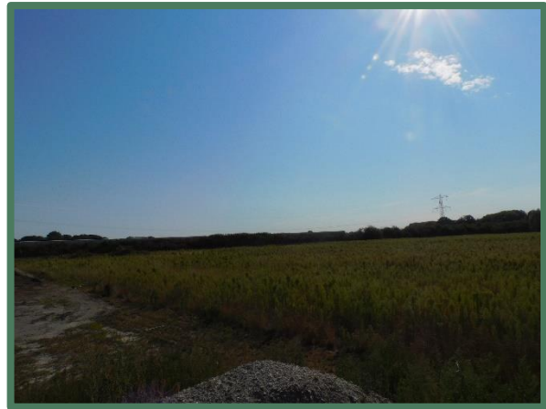
plangebied vanaf noord