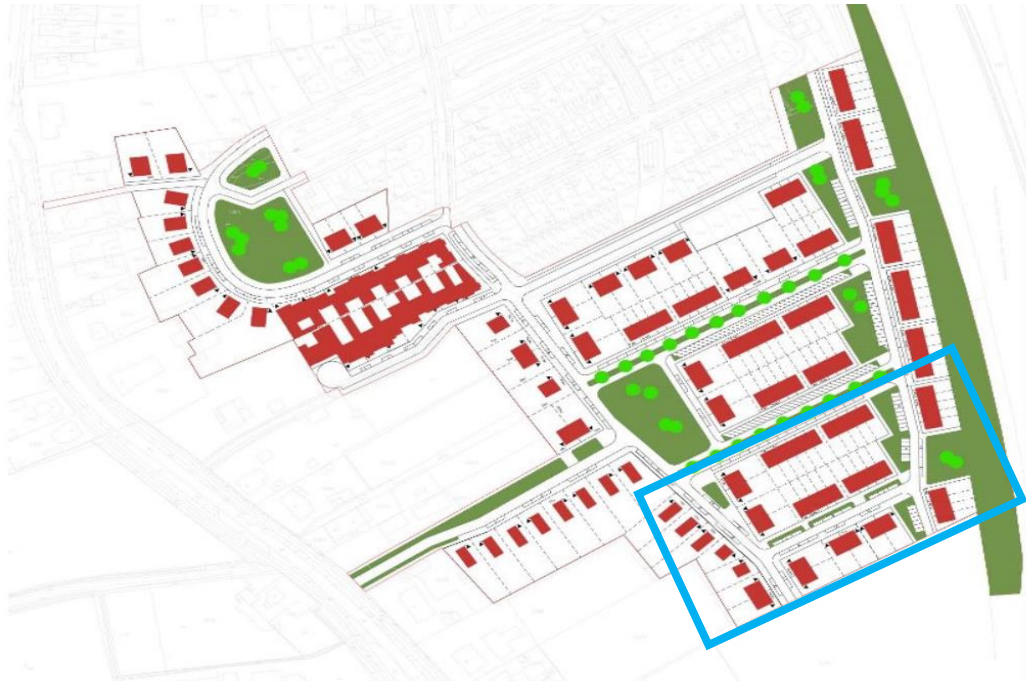
Voorgenomen ontwikkeling.