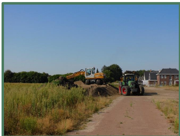
Plangebied vanaf bebouwde deel

De oostkant van het plangebied wordt begrenst door de A50 waarnaast een geluidswal is gelegd. Deze wal is begroeid met vegetatie waaronder riet, wederik, hondsroos en hazelaar.