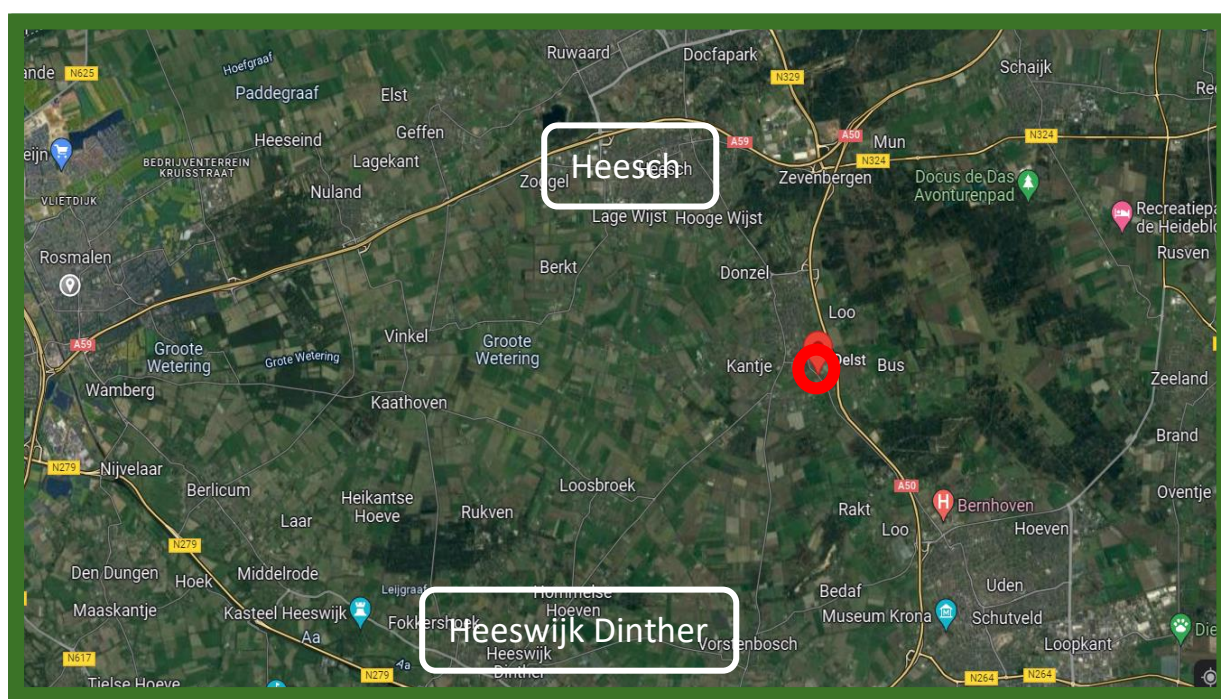
Satellietfoto omgeving plangebied, planlocatie is rood omcirkeld.

De ligging van het plangebied in de ruimere omgeving is weergegeven in onderstaande afbeelding.