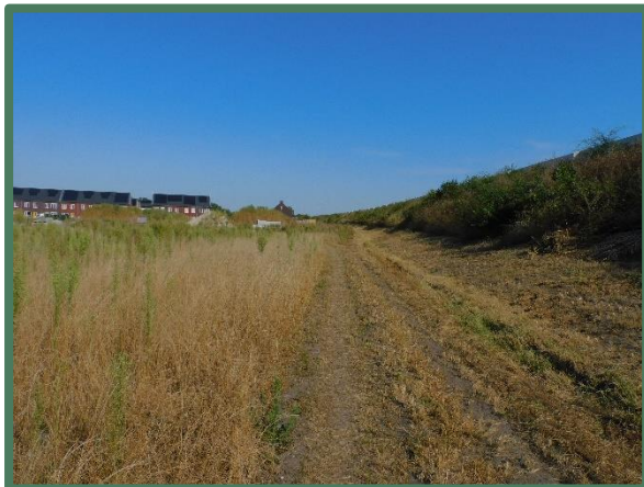
Grens plangebied met geluidswal naast A50 vanaf zuid