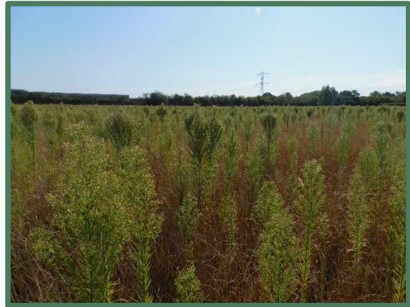
Plangebied vanaf zuid