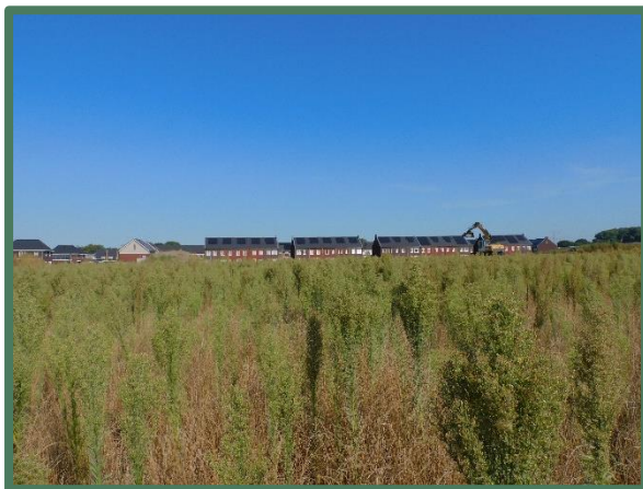
Plangebied vanaf zuid