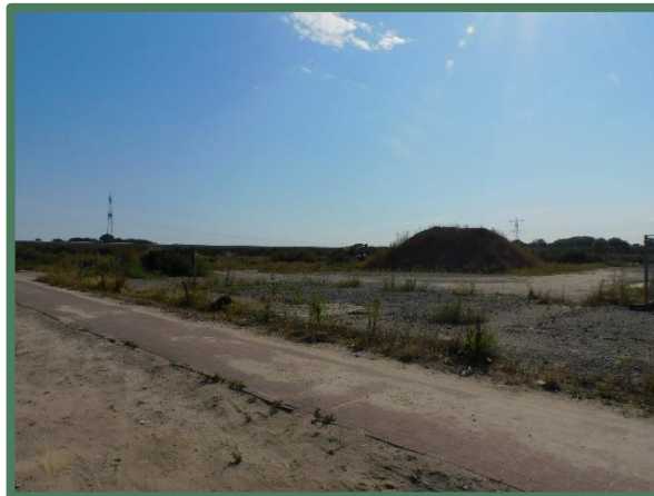
Plangebied vanaf bebouwde deel