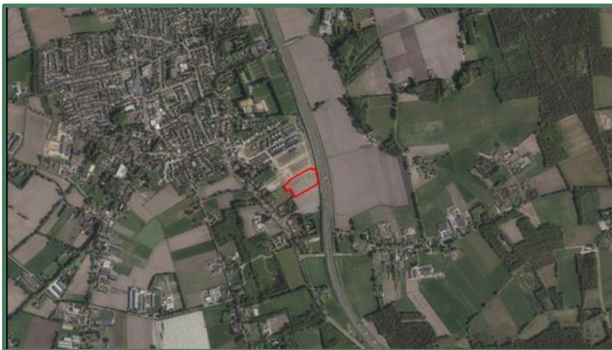
Globaal omlijnde planlocatie in rood.