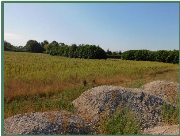
Plangebied vanaf noord