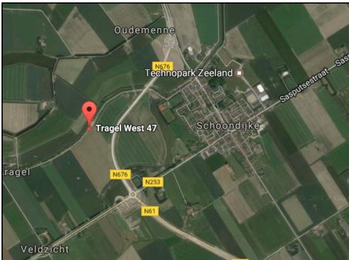
Figuur 1: Luchtfoto planlocatie