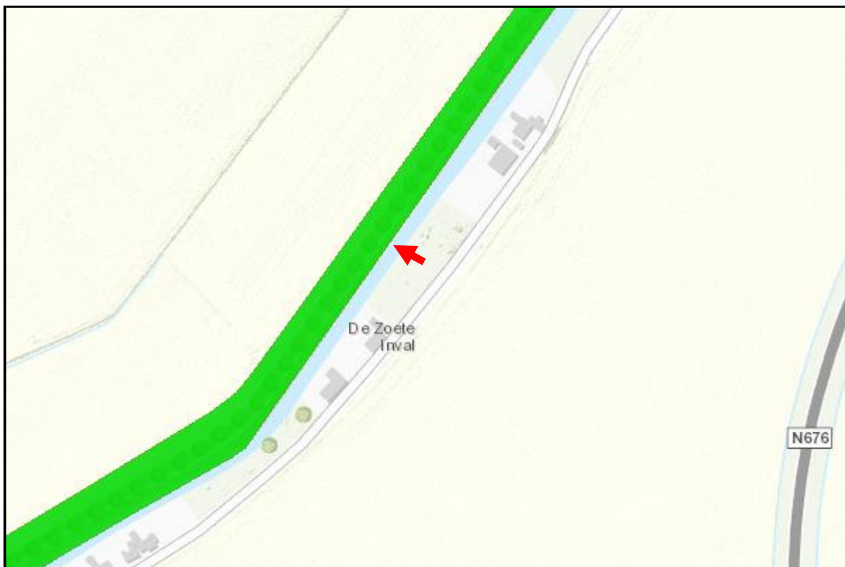
Figuur 5: Omliggende gebieden Natuurnetwerk Zeeland (Geoweb Zeeland)

Naast de Natura2000 gebieden waarborgt de Wet natuurbescherming het Natuurnetwerk Nederland de belangen van de aanwezige flora en fauna. In de directe omgeving van het plangebied aan de Tragel West 47 zijn gebieden aangewezen die zijn gelegen in het Natuurnetwerk Zeeland. Dichtstbijzijnde gebied betreft de Dijken West-Zeeuws Vlaanderen op circa 6 meter ten noorden van het plangebied. Het plangebied wordt gescheiden van deze dijk door een circa 6 meter brede watergang. Gezien de aard van de functieverandering, zijn er voor de beschermde gebieden geen significante negatieve effecten te verwachten als gevolg van het plan (zie figuur 5).