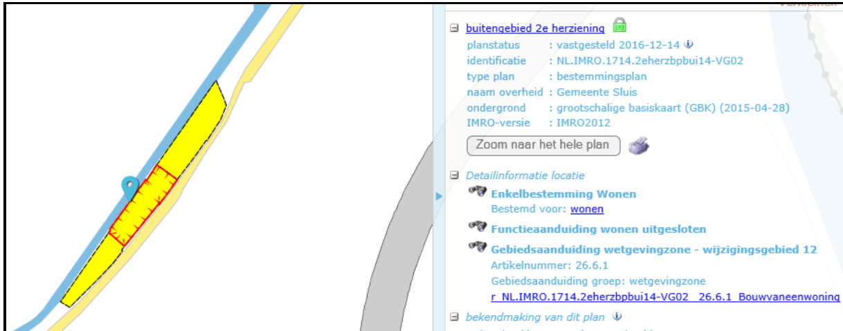
Figuur 4: Uitsnede bestemmingsplan Buitengebied 2 e herziening

Op de gronden is het bestemmingsplan Buitengebied 2 e herziening van de gemeente Sluis van kracht (vastgesteld door de Raad d.d. 14-12-2016). In dit bestemmingsplan is het plangebied gelegen binnen de bestemming 'Wonen'. Tevens is voor het gehele plangebied de functieaanduiding wonen uitgesloten van toepassing en is de gebiedsaanduiding wetgevingszone – wijzigingsgebied 12 opgenomen.