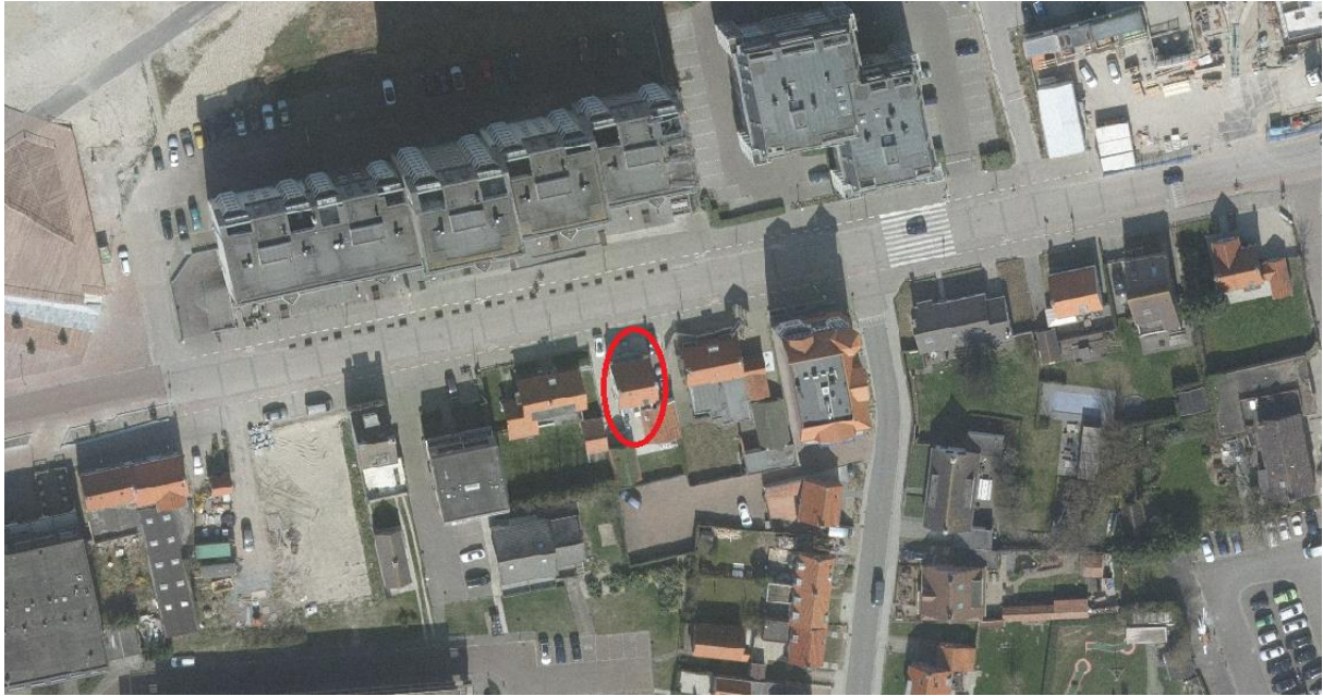
Figuur 2. Luchtfoto van het plangebied en de omgeving.

De geplande activiteit houdt in: het slopen van bebouwing en het bouwen van nieuwe woningen.