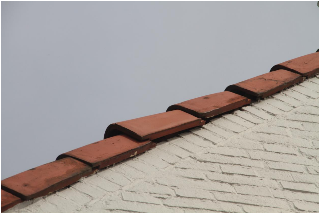
Foto 3. Loszittende pannen (potentieel dagverblijf voor vleermuizen).