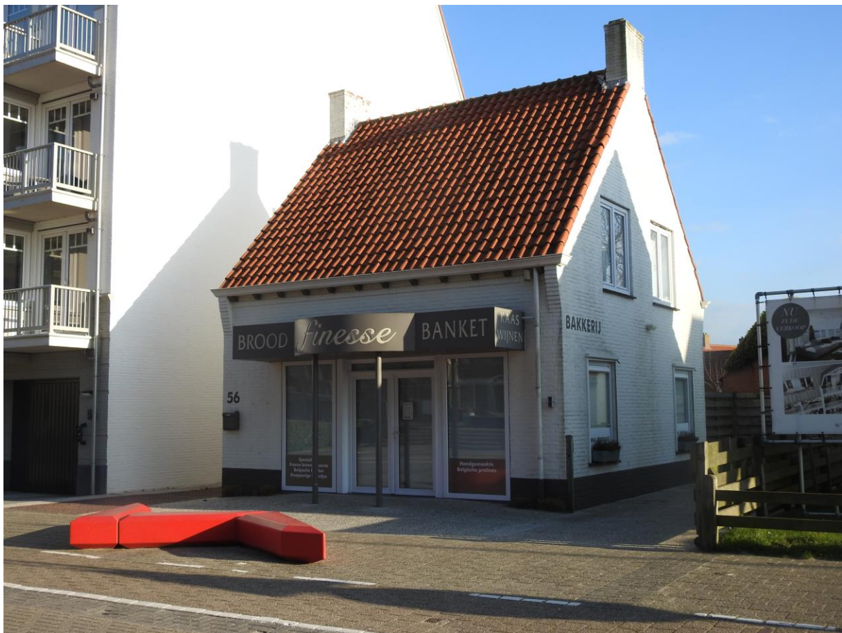
Foto 1. Foto plangebied.

Het plangebied is gelegen in Cadzand-Bad in de gemeente Sluis. Het betreft een gebouw zonder tuin. De omgeving bestaat uit bebouwing met tuinen en duinen met struwelen.