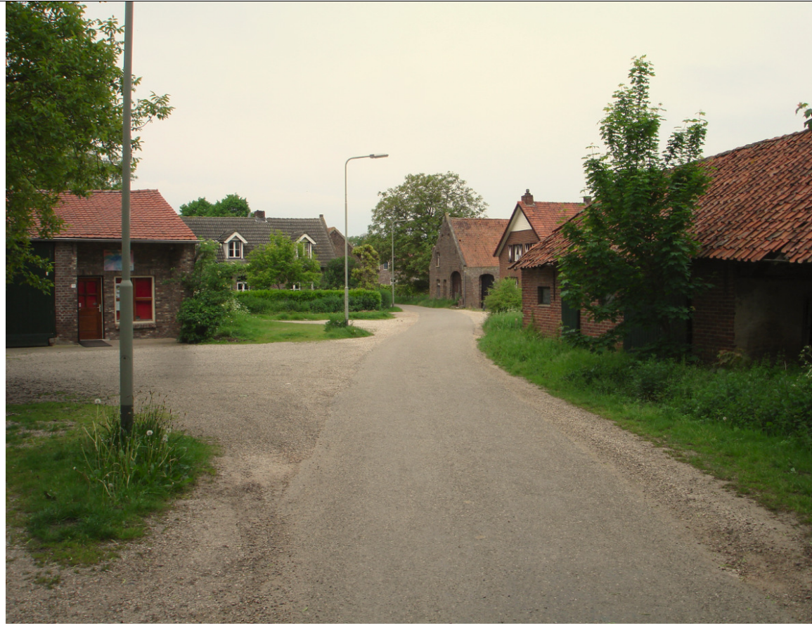
De karakteristieke coulissenwerking van de verschillende boerderijen en bijgebouwen rondom de weg in Ophoven (foto: Luuk Keunen, 6 mei 2014).