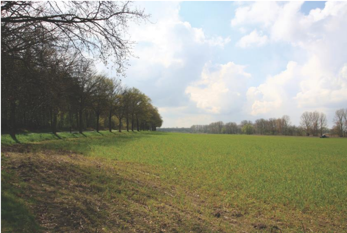
Referentiefoto waardevol gebied Op d'n Berg