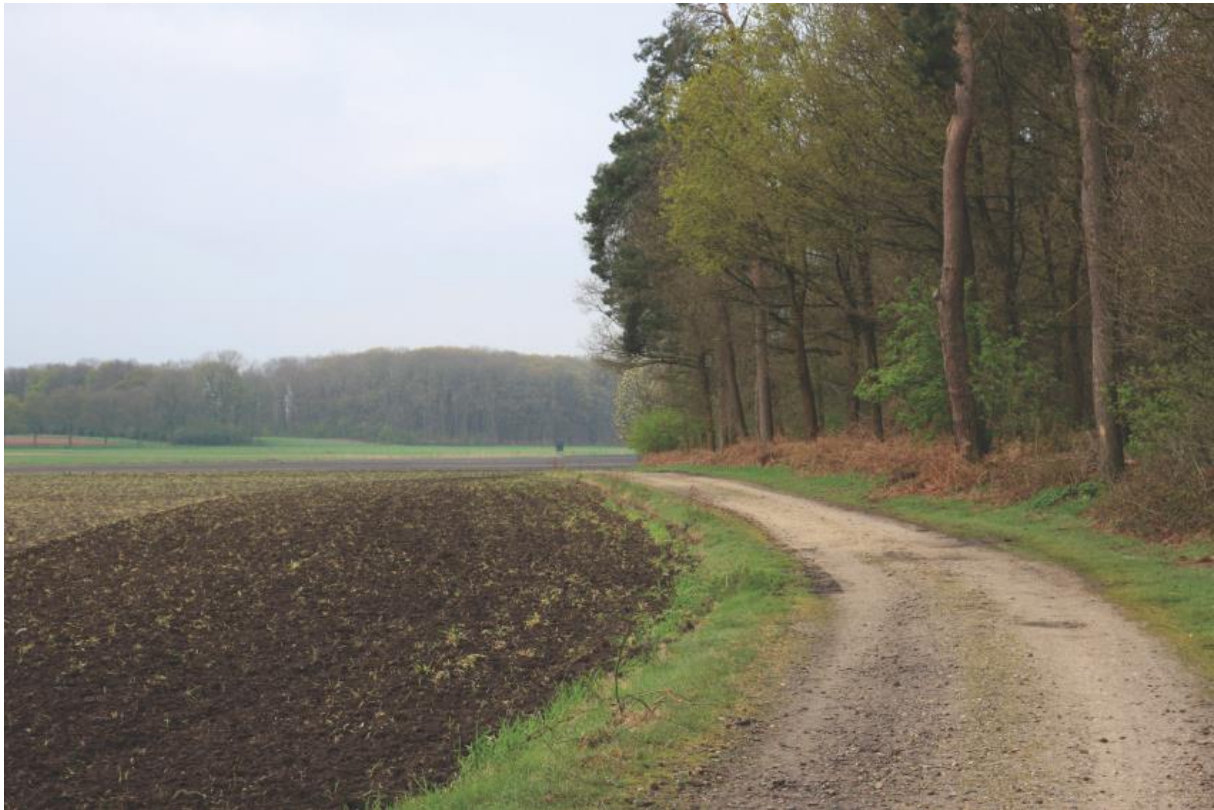
Referentiefoto waardevol gebied Broek en Hei