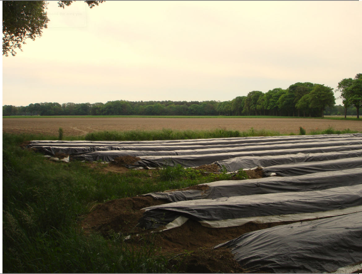
Eén van de landschappelijke 'kamers' van Marissen – 't Leen (foto: Luuk Keunen, 6 mei 2014).