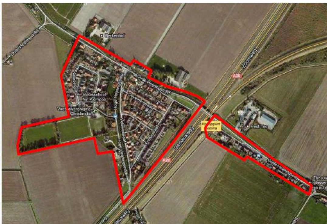
Afbeelding 1: globale begrenzing plangebied Heijningen

Het plangebied betreft de kern Heijningen en deel van de Oude Heijningsedijk. De rijksweg A29 doorsnijdt het plangebied in noord-zuidelijke richting. Deligging van het plangebied is weergegeven in afbeelding 1.