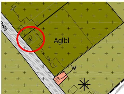
Uitsnede geldend bestemmingsplan

De betreffende woning heeft in het geldende bestemmingsplan buitengebied de bestemming Agrarisch-glastuinbouw en een bouwvlak.