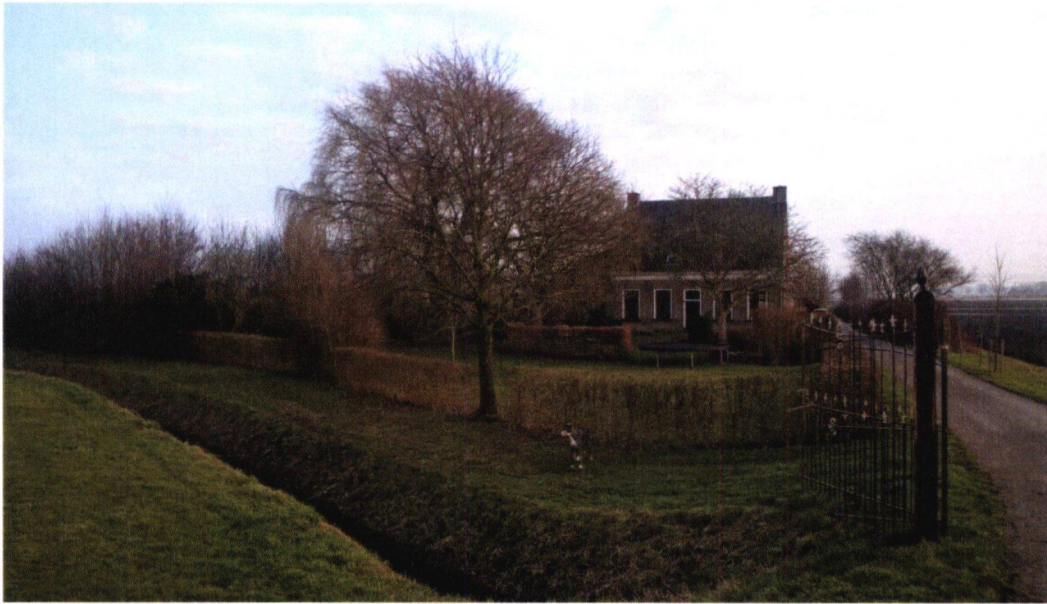
Figuur 15: Foto 10, voortuin vanaf de Achterdijk gezien