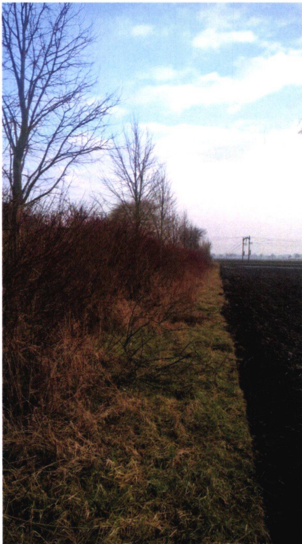
Figuur 8: Foto 3, westelijke bosschage met veel struiken (o.a. kornoelje) en enkele bomen.