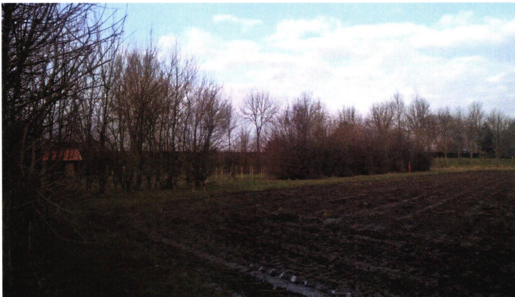
Figuur 11: Foto 6, vanaf rand perceel naar noordoosten