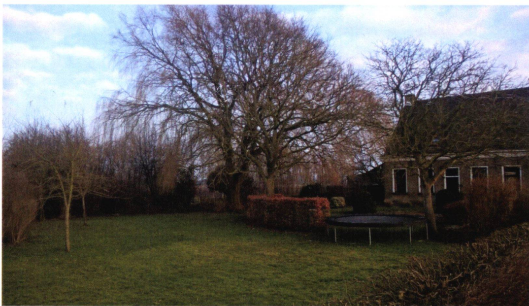
Figuur 14: Foto 9, voortuin vanaf straatzijde (wilgenboom en enkele fruitbomen)