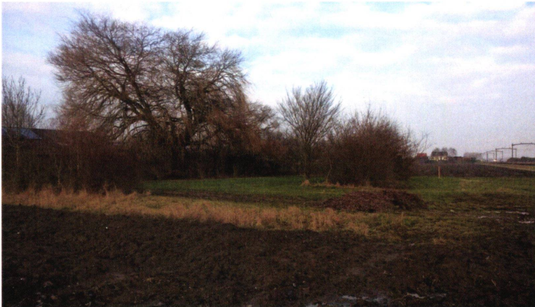
Figuur 9: Foto 4, vanaf westelijke akker