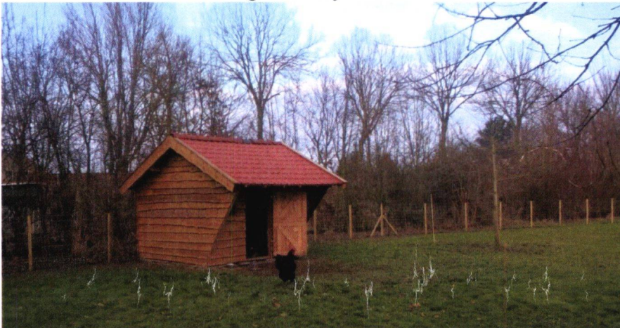
Figuur 4: foto van schuurtje

In de in de nasleep van het tafeltjesgesprek is in e-mailcorrespondentie tussen gemeente Moerdijk (i.c. Daniëlla de Kuijper/ Eelke de Rooij) en fam. van der Lely aangegeven dat binnen een bestemming Wonen een extra schuur niet is toegestaan omdat er al veel voormalige bedrijfsgebouwen op het erf aanwezig zijn. Een mogelijkheid is om hier de bestemming Tuin op te nemen met de aanduiding 'specifieke vorm van tuin - gebouw'. Dan is de bouw van een schuilstal van max. 12 m 2 toegestaan met een maximale goot- en bouwhoogte van respectievelijk 2 m en 2,5 m.. De voorwaarde om hieraan te kunnen meewerken, is dat er dan wel een schets voor de landschappelijke inpassing moet laten maken. Verzocht wordt om de bestemming dusdanig vorm te geven dat een schuurtje met de vermelde maximale afmetingen kan blijven staan.