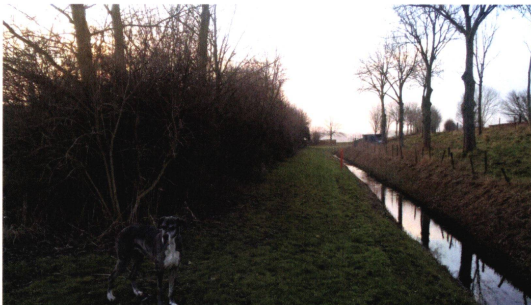
Figuur 13: Foto 8, langs de noordzijde van het perceel