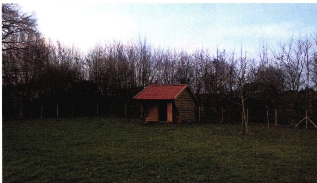
Figuur 12: Foto 7, inkijk in wei met schuurtje