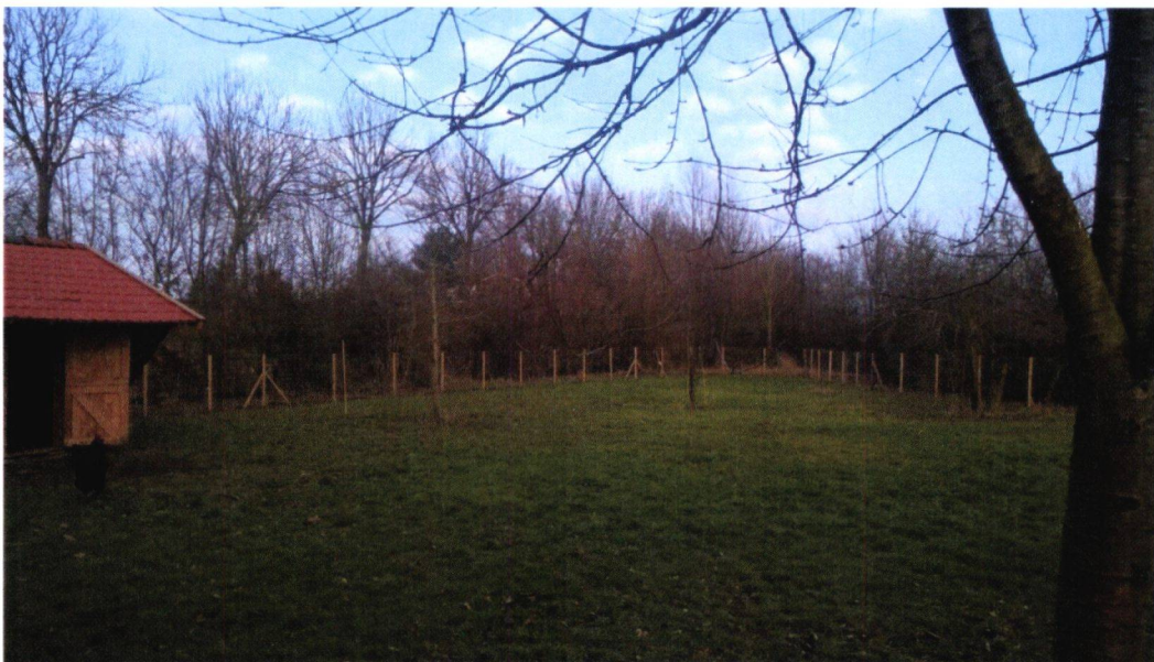
Figuur 16: Foto 12, wekje met fruitbomen (kers en appel), volledig omzoomd door bosschages.