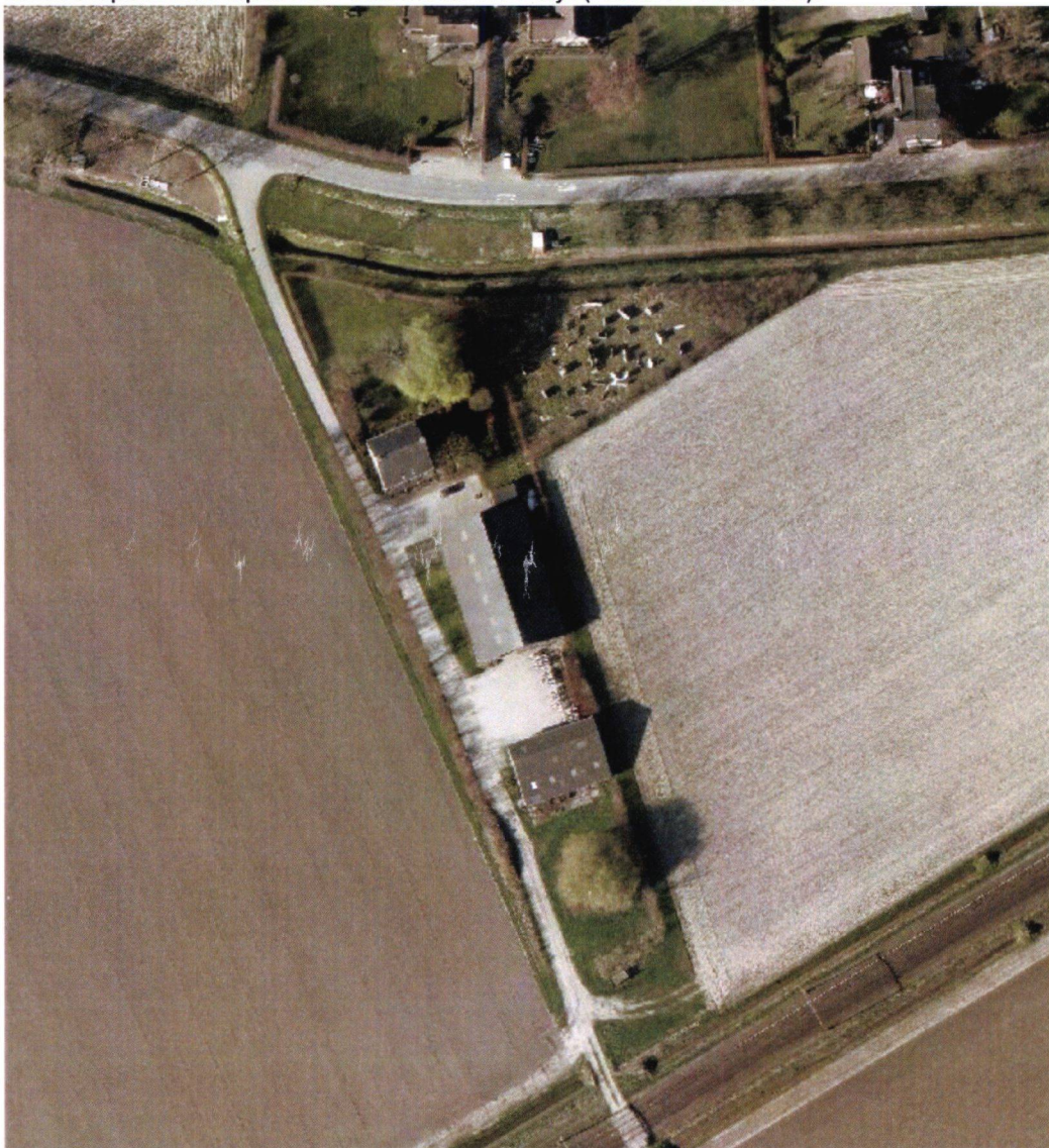
Figuur 1: Luchtfoto (2015) van het betreffende perceel

De eisen waarvan uitgegaan wordt in dit document staan beschreven in het Landschapskwaliteitsplan van Gemeente Moerdijk (versie 19 mei 2016).