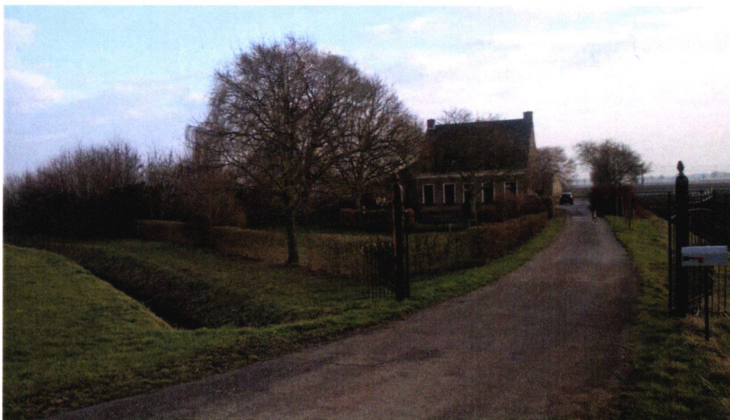
Figuur 6 Foto 1, vanaf oprit perceel