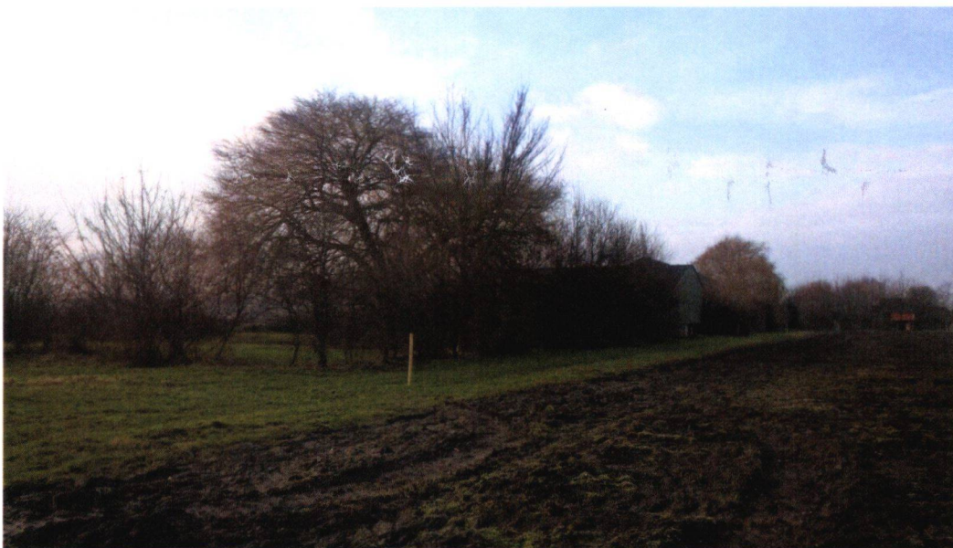
Figuur 10: Foto 5 vanaf oostelijke akker