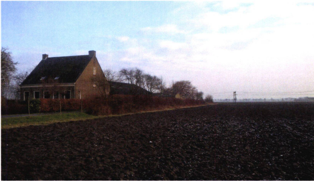
Figuur 7: Foto 2, vanaf westelijke akker