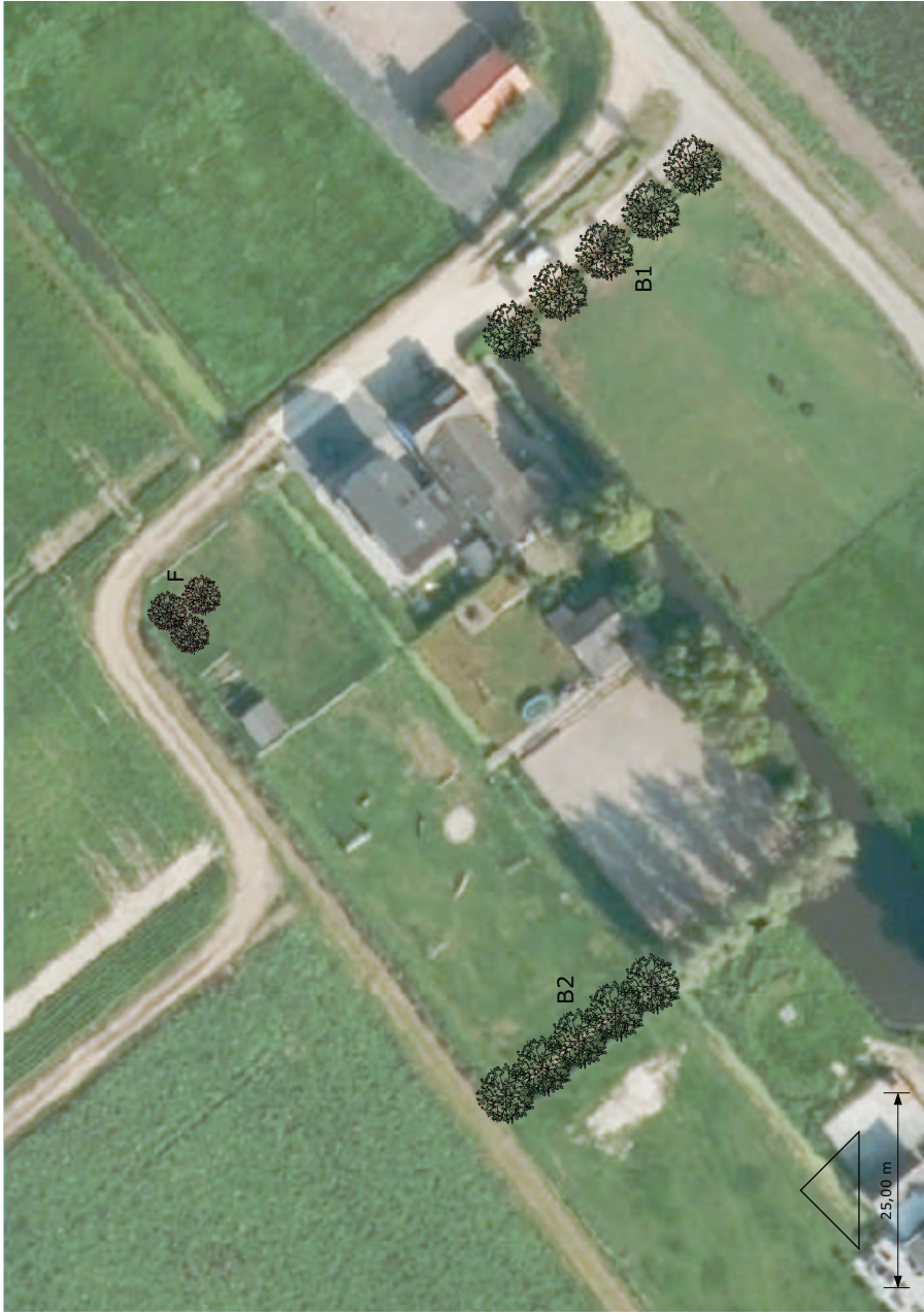
Luchtfoto bestaande situatie met te wijzigen perceel