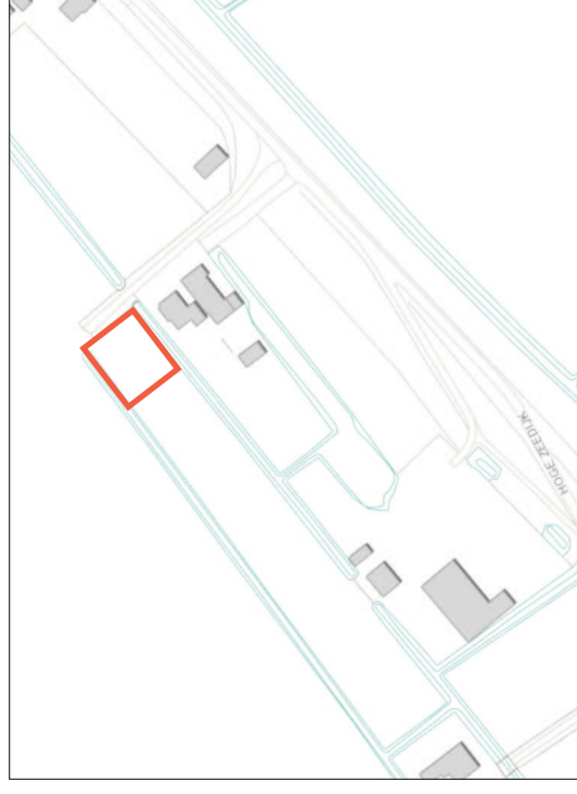
Topografie bestaande situatie met te wijzigen perceel