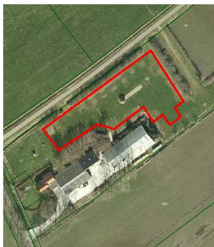
Figuur 2: Bestaande camping met ruimte voor 20 kampeermiddelen = rode contour.