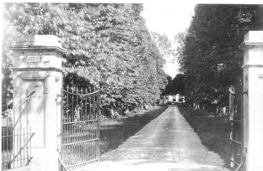
Oude foto oprijlaan naar huize Leemkuil, nu Leemkuilselaan

Langs de Leemkuilselaan is aan beide zijden fraaie monumentale laanbeplanting te vinden, die vroeger onderdeel uitmaakte van de oprijlaan naar huis de Leemkuil.