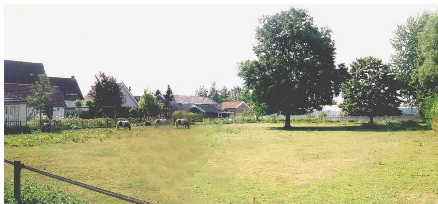
Open groene gebieden aan de Molenwei

Opvallend zijn verder de open groene ruimten achter de dijk tussen de bebouwing aan de Molenwei. Deze weiden en moestuinen bewerkstellingen het open, dorpse karakter van het gebied. Door de open ruimten zijn mooie doorzichten naar en vanaf de Waaldijk mogelijk.