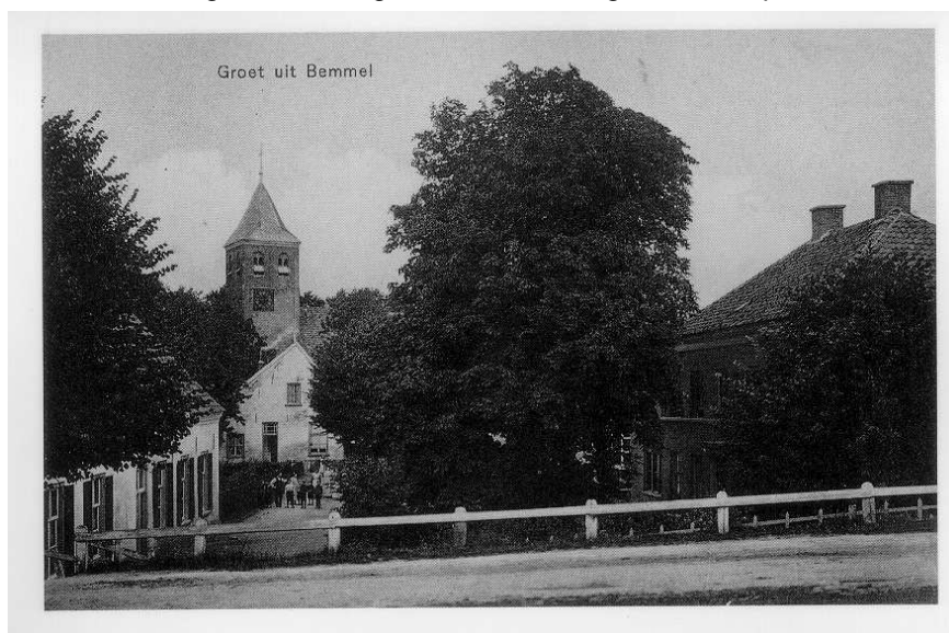
Oude ansichtkaart met zicht op Oude Kerkhof vanaf de dijk

Langs de Dorpsstraat ontbreekt elke vorm van beplanting, zodat de straat haar dorpse karakter verloren heeft en, mede door de asfaltering van de straat, veel meer een doorgaand karakter heeft gekregen.