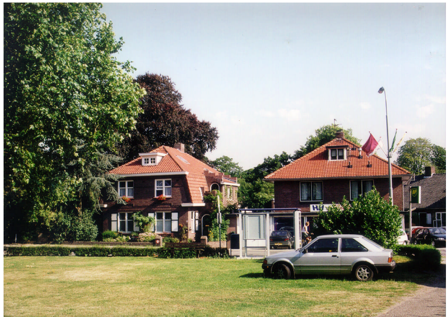
Zicht op de Dorpsstraat vanaf Oude Kerkhof

De Dorpsstraat is het tweede opvallende lineaire element in het gebied. Het is vanouds de doorgaande route door Bemmels die zich door het dorp slingert. Het is een vrij brede asfaltweg met voornamelijk vrijstaande bebouwing uit diverse perioden. Naast woningen zijn er bedrijven, winkels en horeca te vinden. Ter plaatse van de Oude Kerkhof maakte de Dorpsstraat vroeger een knik richting de dijk. Later is deze bocht er voor doorgaand verkeer uitgehaald en volgt de straat de route van het oude tramlijntje. Het resterende dwarsstraatje ligt hierdoor een beetje onbegrepen binnen de oude dorpskern. Het straatje maakt mede door haar invulling met bedrijfjes en de daarmee ontbrekende groeninrichting van de voorerven een stenige kale indruk.