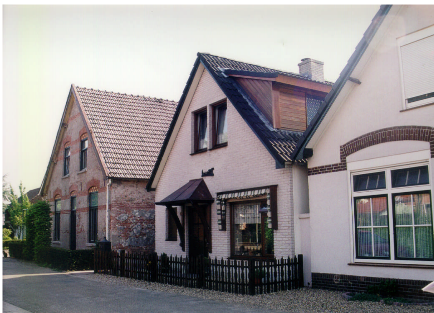
Karakteristiek bebouwing aan de Molenwei

Het "Zonnehuis", een 19 e eeuwse pand staat aan de Teselaar. Samen met de grote tuin, een ijzeren spijlenhek en het koetshuis vormt het een waardevol ensemble. Het is dan ook een gemeentelijk monument.