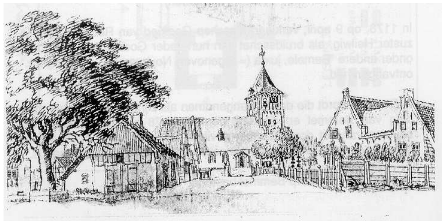
Tekening van J. de Beyer uit 1742

De schuren aan de westzijde van het Oude Kerkhof staan met de achterzijde naar de kerk toe. Dit is geen fraai beeld en de schuren verstoren de sfeer van het Oude Kerkhof. De panden aan de noordoostzijde passen beter in de vierkante structuur en in de sfeer van het Oude Kerkhof.