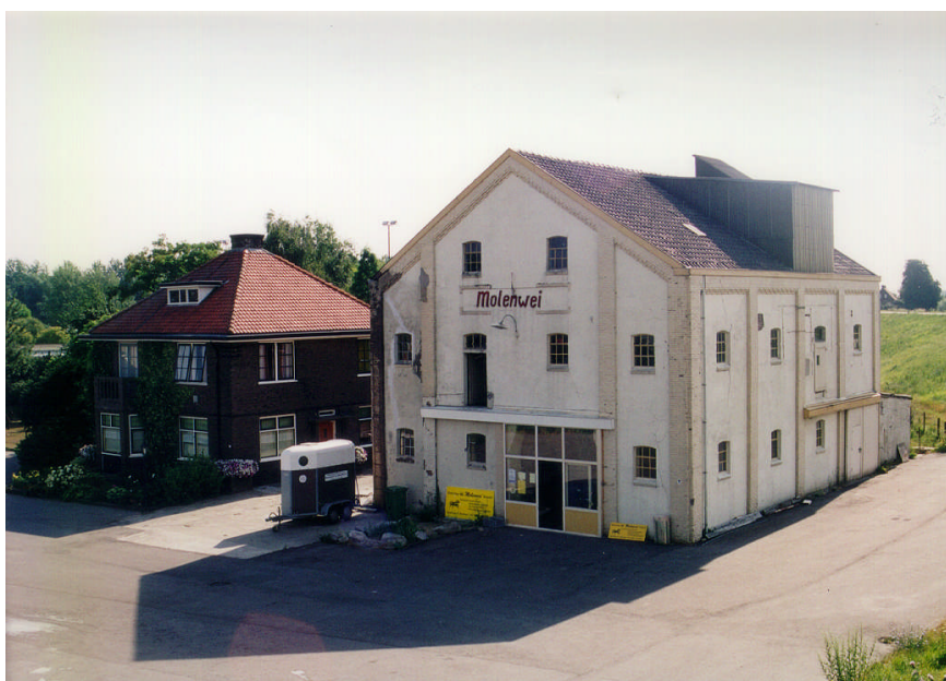
Voormalige maalderij aan de Waaldijk

De overige panden in het gebied zijn op zichzelf niet van grote architectonische of cultuurhistorische waarde, maar voegen zich in het algemeen goed in het dorpsbeeld.