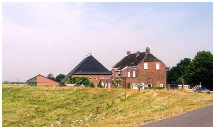
De Arend aan de Waaldijk

Een belangrijk structurerend, lineair element in het gebied is de Waaldijk, die Bommel tegen het Waalwater beschermt. Onlangs is de dijk nog verzaaid zodat het door het hoogteverschil een opvallend element in het landschap is. Vanuit een groot deel van het gebied is de dijk goed waarneembaar. Vanaf de dijk heeft men een mooi uitzicht over de oude kern van Bommel. Onder aan de dijk zijn enkele dijkwoningen en boerderijen gelegen. Buitendijks ligt de voormalige herberg de Arend met twee forse schuren. Karakteristiek voor de dijkzone is de afwisseling tussen de landelijke open weiltes en de vrijstaande boerderijen langs de dijk.