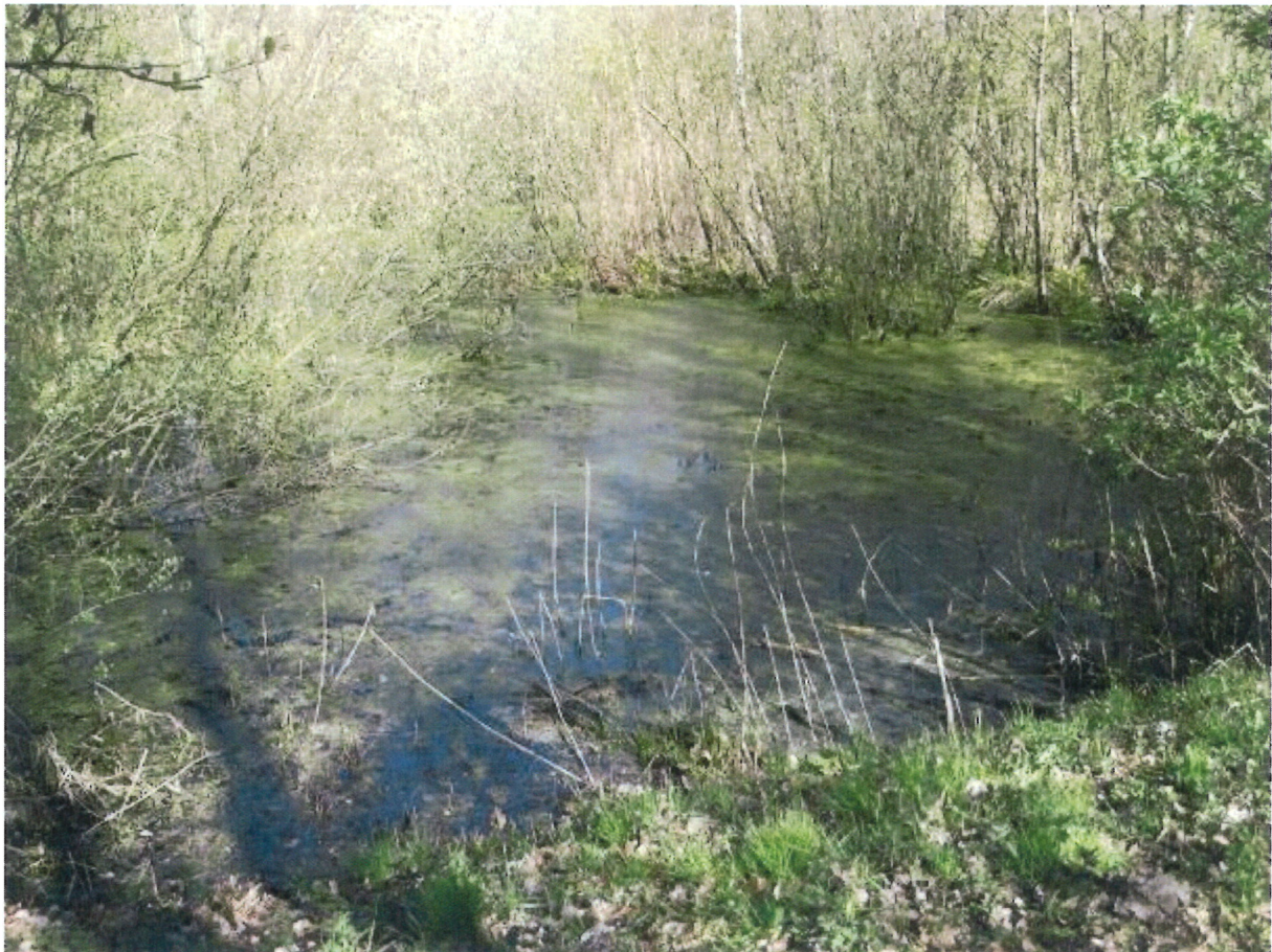
Huidige situatie van het veentje aan de Schurerslaan

Maar is er wel een plus te bereiken ten aanzien van de natuurwaarden op het recreatieterrein zelf. De huidige natuurwaarden op het terrein zijn minimaal. Dit is onder andere het gevolg van het strak gemaaide en aangeharkte karakter van het terrein. Een meer natuurlijke inrichting met extensiever beheer zal leiden tot meer variatie in dier- en plantensoorten. Dit geldt behalve voor de grasvelden, ook voor de recreatieplas en de visplas. Het beheer is daar momenteel intensief, waarbij de visplas regelmatig kunstmatig droogvalt en wordt opgeschoond. Hierdoor krijgt de natuur op het terrein weinig kans. Minder beheren en een meer natuurlijke oever met oever- en waterplanten levert natuurwinst op. Behoud van het veentje langs de Schurerslaan draagt eveneens bij aan de natuurwaarde op het terrein, mits het veentje wordt ontdaan van de dichte begroeiing. De bij het onderdeel landschap genoemde verzwaring van de groenstroken draagt ook bij aan de verhoging van de natuurwaarden.