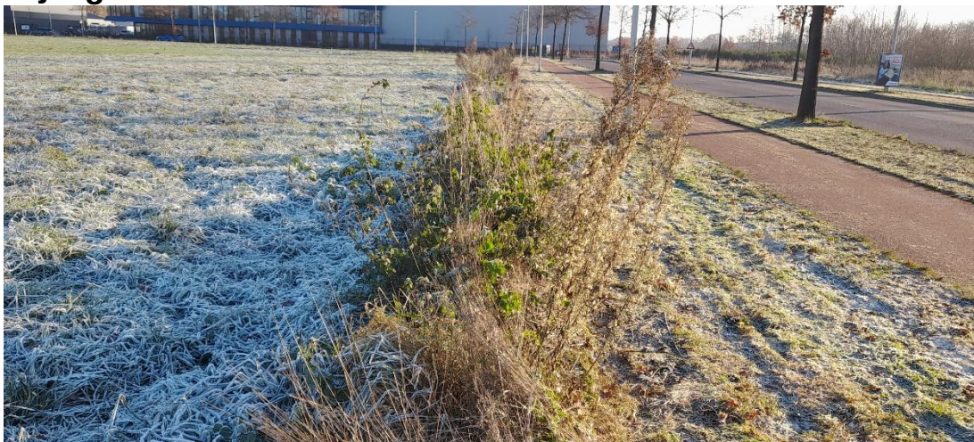
Figuur 1: Het weiland en de minder korte rand nabij de wegen