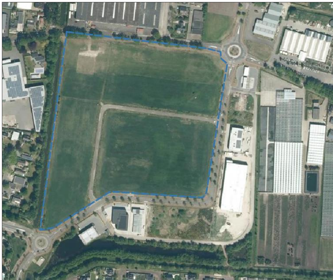
Figuur 2.1: Luchtfoto. Onderzoekslocatie ligt binnen de contour.