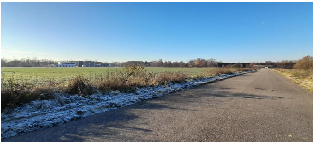
Figuur 4: Overzicht foto van het plangebied