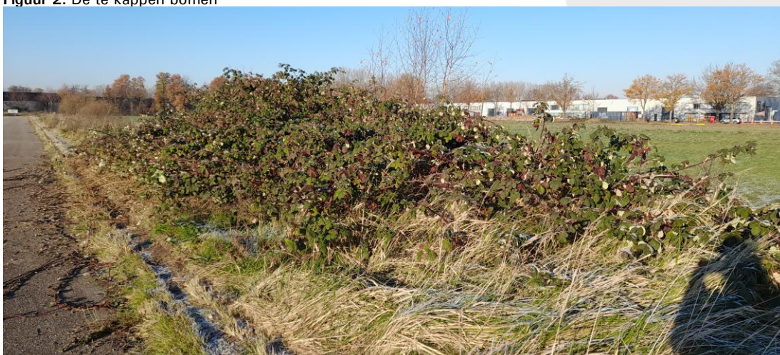
Figuur 3: Braamstruweel op het plangebied