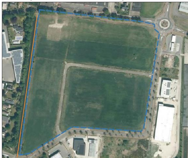
Figuur 4.2: Luchtfoto. Onderzoeklocatie ligt binnen de contour. De oranje lijn is de mogelijke vliegroute

Tijdens de veldinspectie zijn op de locatie geen sporen aangetroffen die duiden op de aanwezigheid van vleermuizen. Er zijn tevens geen holtes aangetroffen in de te kappen bomen. De bomenrij ten noorden van het plangebied kan niet als vliegroute gebruikt worden omdat deze in de noordoost hoek van het plangebied al onderbroken is door een rotonde en straatverlichting. De watergang aan de westzijde van het plangebied kan wel als vliegroute gebruikt worden door de watervleermuis. Verder is de locatie voornamelijk geschikt als foerageergebied voor diverse vleermuis soorten. In de omgeving is voldoende groen aanwezig zodat dit niet tot een negatief effect leidt.