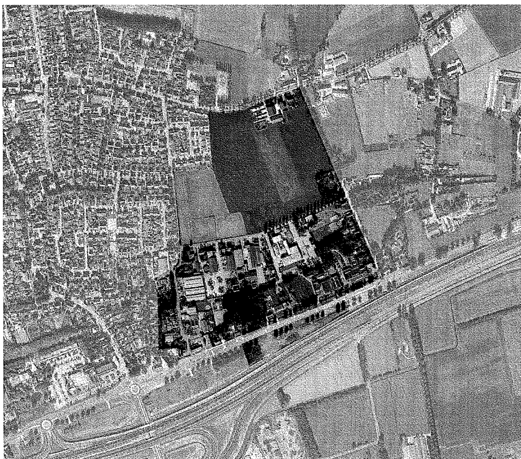
Figuur 1: Kaart omgeving bestemmingsplangebied Nuland Oost