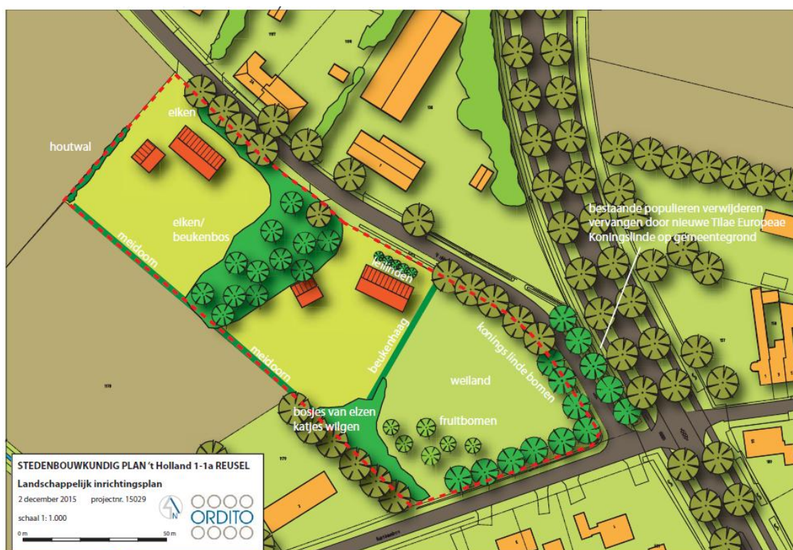
Figuur 2 nieuwe situatie met landschappelijke inpassing