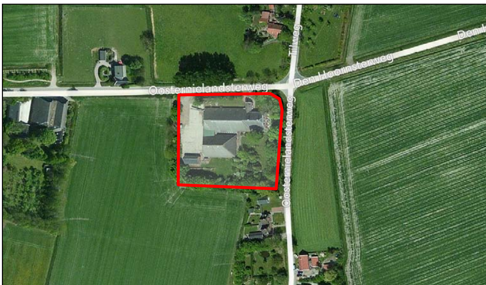
Figuur 1. De ligging van het plangebied

Het plangebied van dit bestemmingsplan betreft het perceel Oosternielandsterweg 26 te Oosternieland. Dit perceel ligt aan de kruising van de Oosternielandsterweg met de Den Hoornsterweg en de Tilweg. De begrenzing is afgestemd op het in het geldende bestemmingsplan toegekende bouwperceel. De ligging van het plangebied is weergegeven in figuur 1.