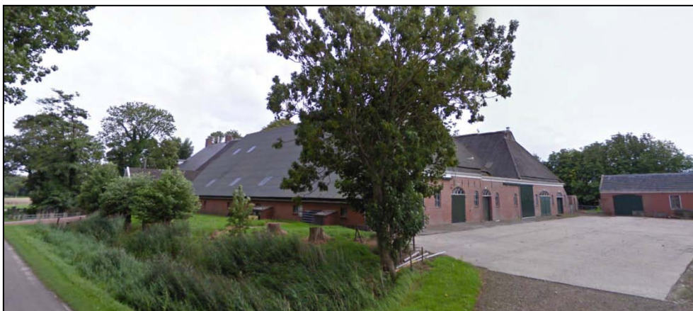
Figuur 2. Aanzicht op het perceel

Binnen het plangebied staat een relatief forse boerderij met daarnaast een agrarische schuur. Het geheel heeft een authentiek landelijk karakter. Het gehele perceel is ingepast met een dichte houtsingel. De ontsluiting vindt plaats aan de noordzijde, op de Oosternielandsterweg. De bedrijfswoning ligt aan de oostzijde van de boerderij en heeft een aparte aansluiting op deze weg. Een aanzicht op het perceel is weergegeven in figuur 2.