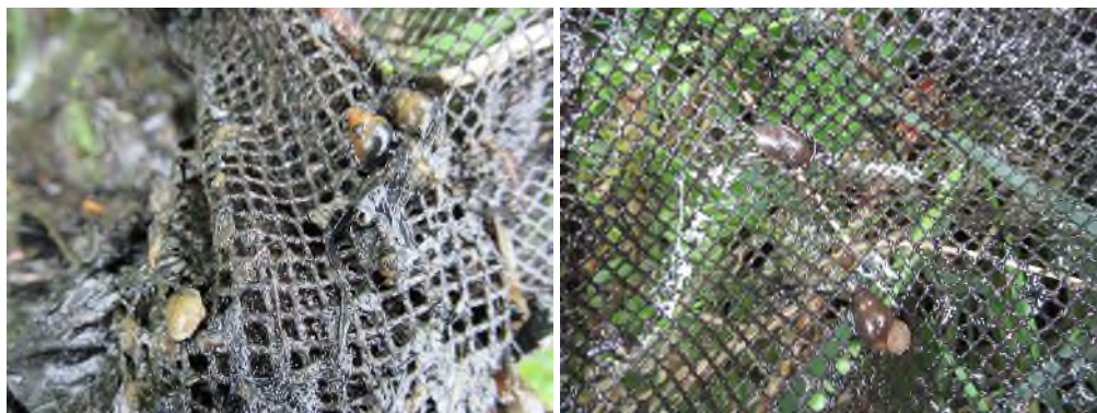
Figuur 4.2. Impressie aanwezige soorten naar aanleiding van bemonstering met RAVON schepnet.

In de provincie Zuid Holland zijn recente gegevens bekend waaruit blijkt dat de platte schijfhoren in meerdere wateren in deze provincie voorkomen. Dit betreft een soort die waar weinig onderzoek naar is gedaan, derhalve zijn op veel plaatsen onvoldoende gegevens bekend over het voorkomen van deze soort. Het plangebied bevat een (troebele) sloot met vrijwel stilstaand water. Tijdens het terreinbezoek zijn geen drijvende waterplanten zoals de gele plomp aangetroffen. Aangezien de Platte schijfhoren voornamelijk voorkomt tussen dergelijke drijvende waterplanten, wordt de Platte schijfhoren niet verwacht in het plangebied. Effecten zijn uitgesloten.