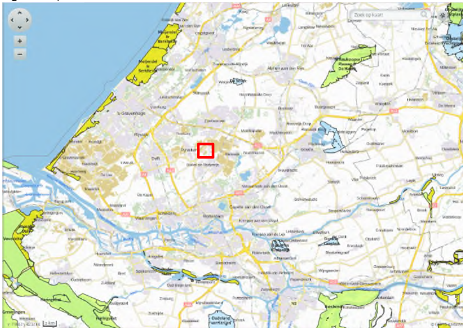
Figuur 4.3. Plangebied (rood omkaderd) en dichtstbijzijnde Natura 2000-gebieden. Bron: AERIUS.

Het plangebied ligt niet in of binnen een straal van 10 km van Natura 2000-gebied, noch . (zie Figuur 4.3).