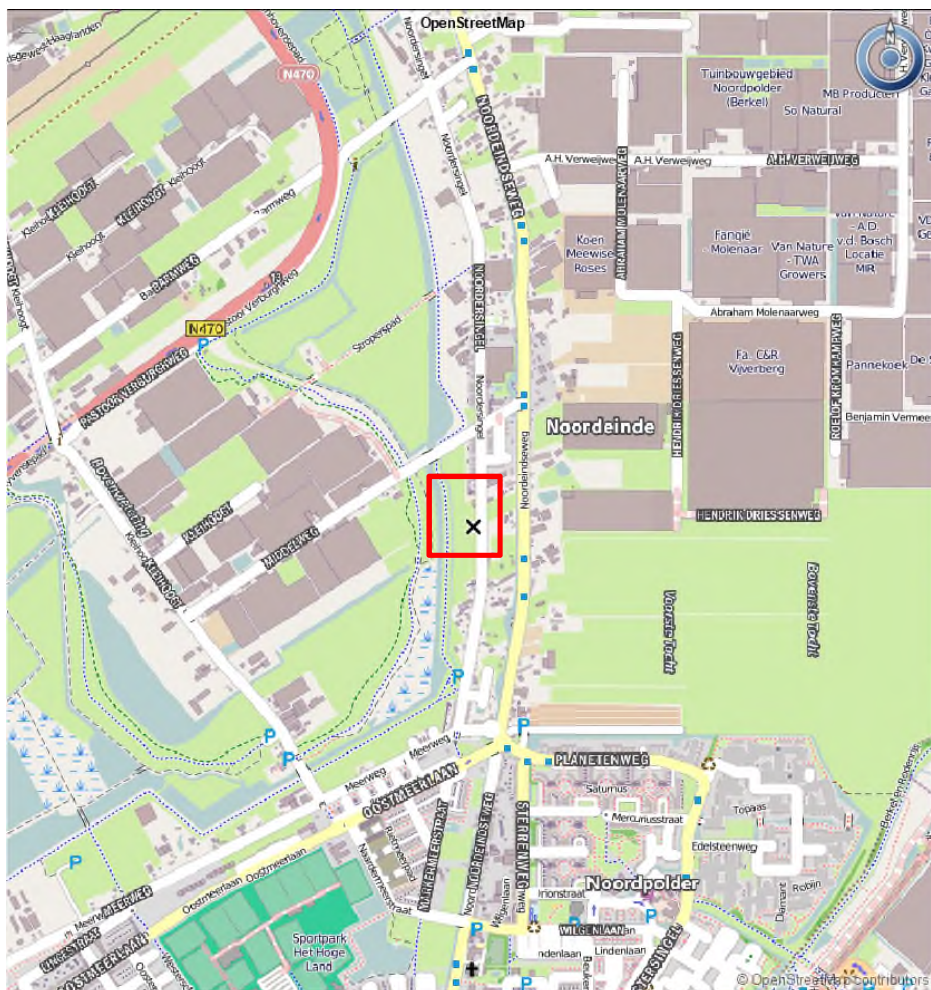
Figuur 1.1. Ligging van het plangebied (rood omkaderd).

Ruimtelijke plannen, zoals dergelijke bestemmingsplan, dienen te worden beoordeeld op de uitvoerbaarheid in relatie tot actuele natuurwetgeving. Er dient onderzocht te worden of het plan effect heeft op beschermde soorten of beschermde gebieden (Wet natuurbescherming; Wnb en Natuurnetwerk Nederland). Ontwikkelingen mogen niet zonder meer plaatsvinden indien deze negatieve gevolgen hebben op beschermde natuurgebieden en/of flora en fauna. In dit kader is inzicht gewenst in de aanwezige natuurwaarden en de mogelijk daarmee samenhangende consequenties. Dit wordt gedaan op basis van een Natuurtoets. In deze rapportage zijn de resultaten van de Natuurtoets beschreven en wordt antwoord gegeven of het plan uitvoerbaar is.