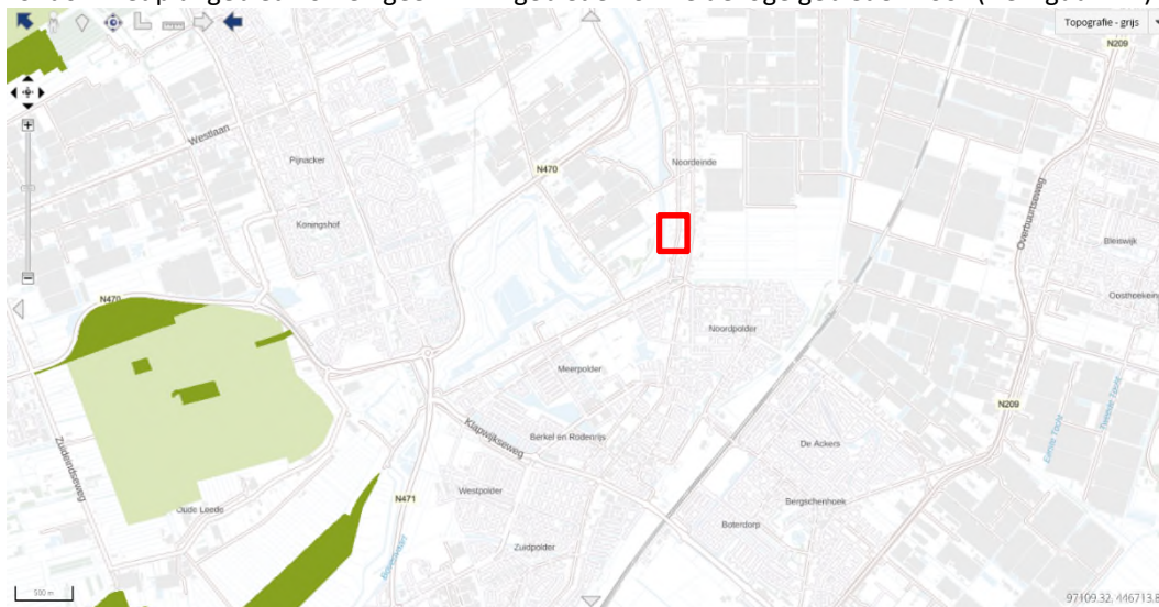
Figuur 4.4. Locatie plangebied (rood omkaderd) en dichtstbijzijnde natuurdoeltype (donkergroen) en weidevogelgebied (lichtgroen).

In het plangebied is geen NNN-gebied aanwezig. Binnen een straal van ruim drie kilometer rondom het plangebied komen geen NNN-gebieden of weidevogelgebieden voor (zie Figuur 4.4).