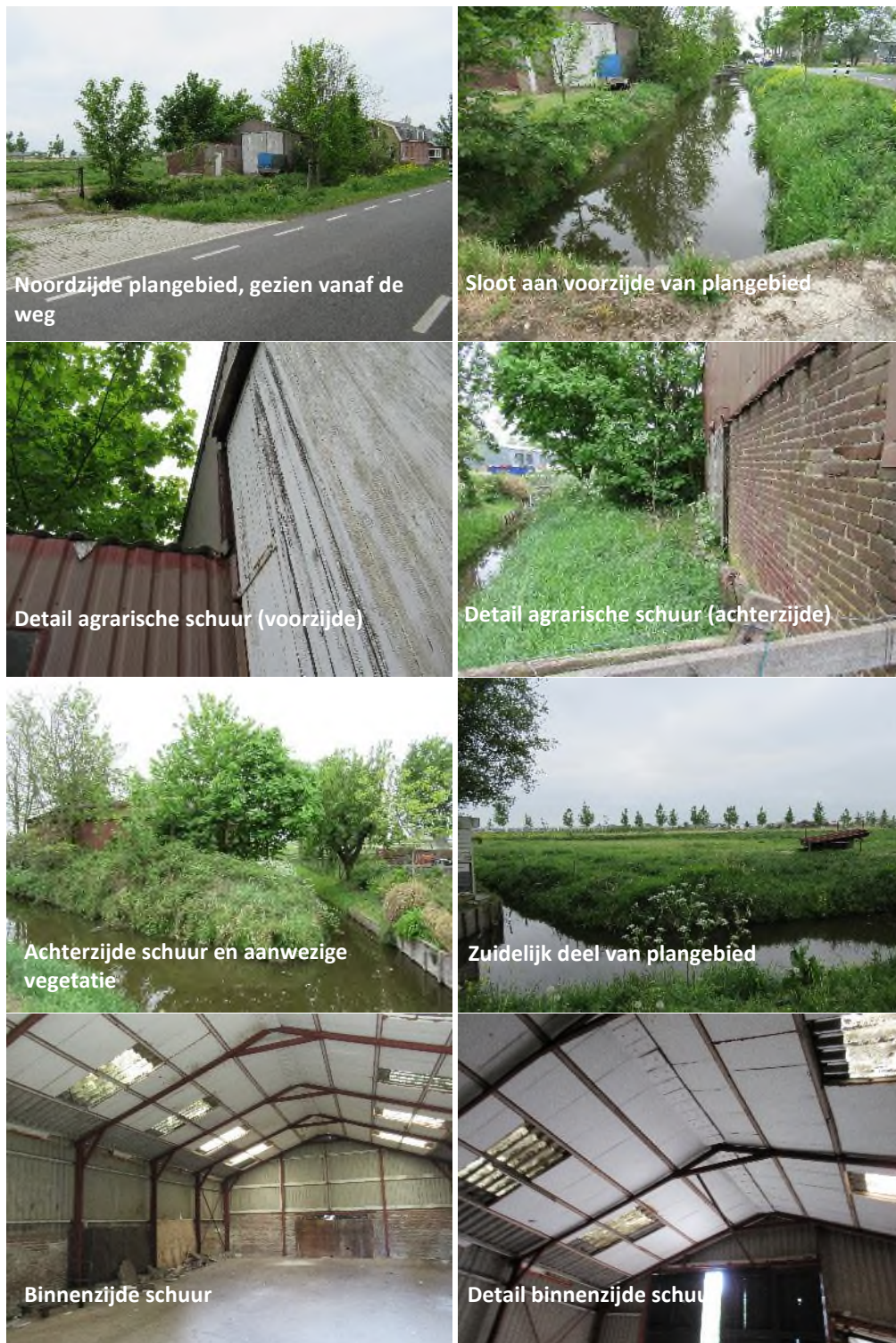
Figuur 4.1. Impressie van het plangebied.