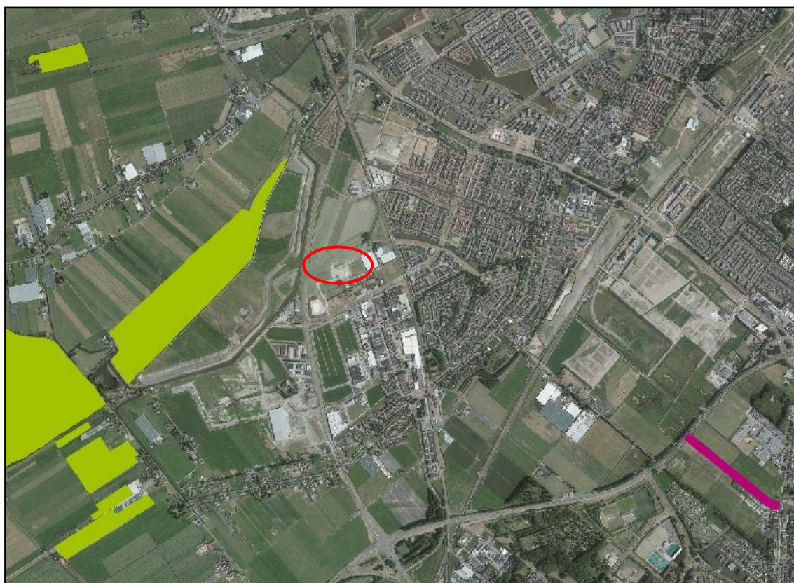
Figuur 3: Ligging plangebied (rood omcirkeld) t.o.v. NNN-gebieden (groen gearceerd)

Het plangebied maakt geen deel uit van het Natuurwerk Nederland (NNN) (figuur 3). Omdat er, als gevolg van de voorgenomen plannen, geen oppervlakte aan NNN-gebied verloren gaat, is er geen toetsing aan de wet- en regelgeving omtrent de NNN nodig.