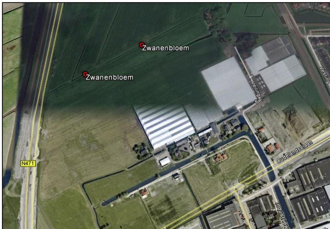
Figuur 5: Locatie groeiplaatsen Zwanenbloem

Wel zijn twee groeiplaatsen van de Zwanenbloem ( Butomus umbellatus ) gevonden (figuur 5). Deze vaatplant wordt vermeld in tabel 1 van de Flora- en faunawet en is daarmee licht beschermd.