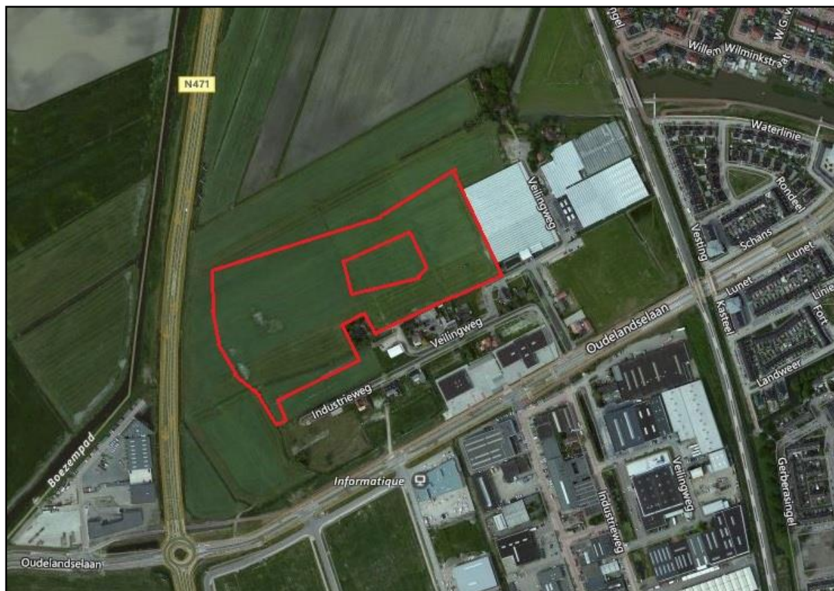
Figuur 2: Begrenzing plangebied (rood omljnd)