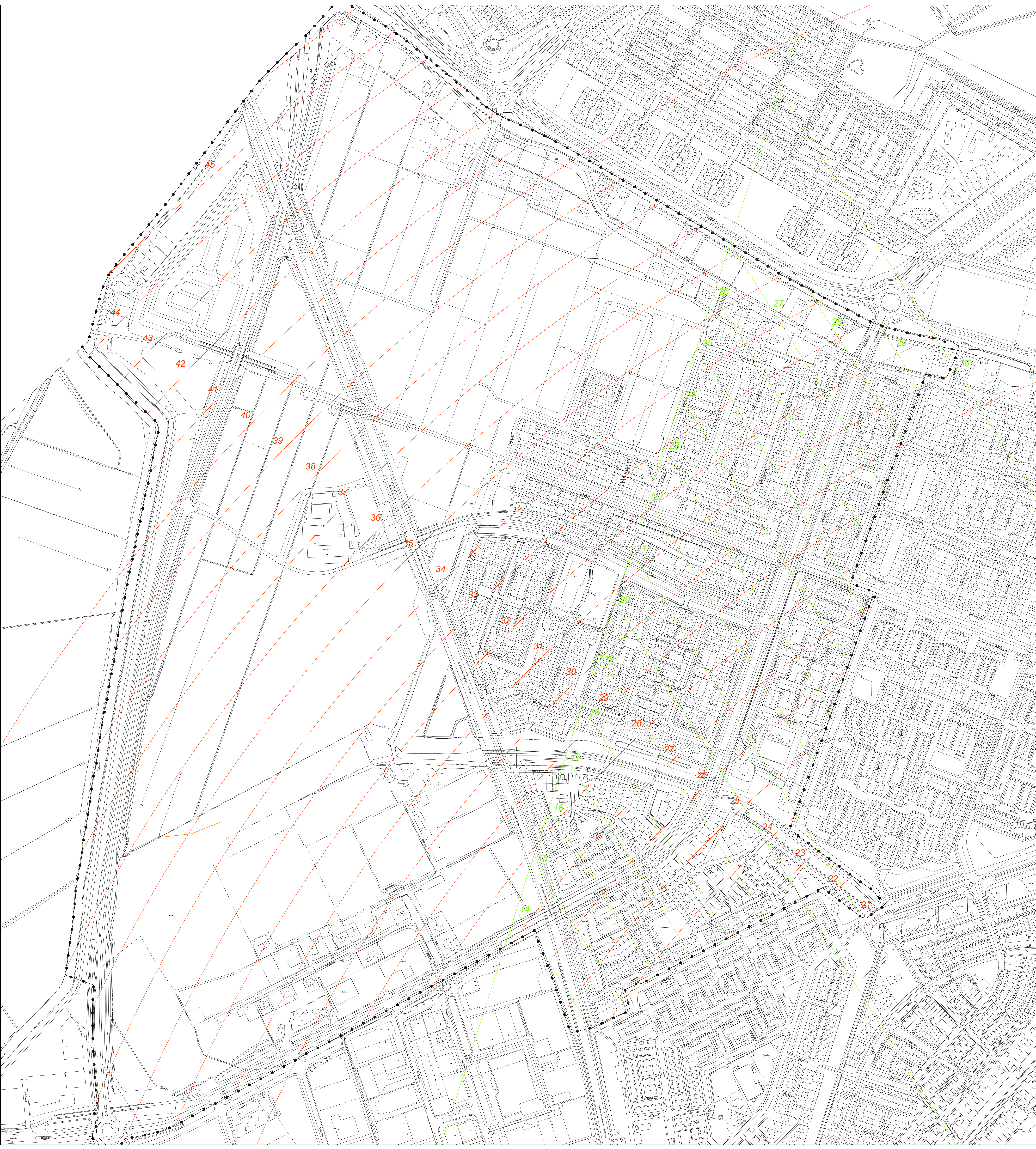
Bijlage 2 bij de regels: Toetsingsvlakken Luchtverkeersleiding Nederland